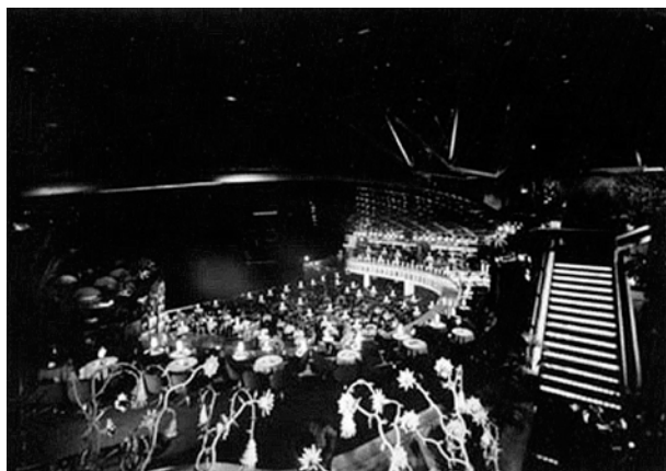
Tito's, ca. 1970.

Tot i l'absència de teatres a l'Eixample de Palma, tal vegada pel fet que són les classes populars les que habitaren aquesta nova àrea de la ciutat fora murades, hi ha una excepció prou significativa: La Casa del Poble (1924-1936), el teatre per a les associacions obreres projectat per Guillem Forteza. L'associacionisme, en el vessant social i polític més que artístic, també va fomentar l'aparició d'una sèrie de nous espais disseminats per la ciutat. Es tracta d'associacions com La Protectora (1886-tancat), el Teatre Mar i Terra (1898-...) —de l'arquitecte Josep Segura—, l'Assistència Palmesana (1901-tancat); el Cercle d'Obrers Catòlics (1878-1929) —posterior Saló Mallorca (1931-1937)— o el Foment del Civisme o Saló de Belles Arts (1925-1934).