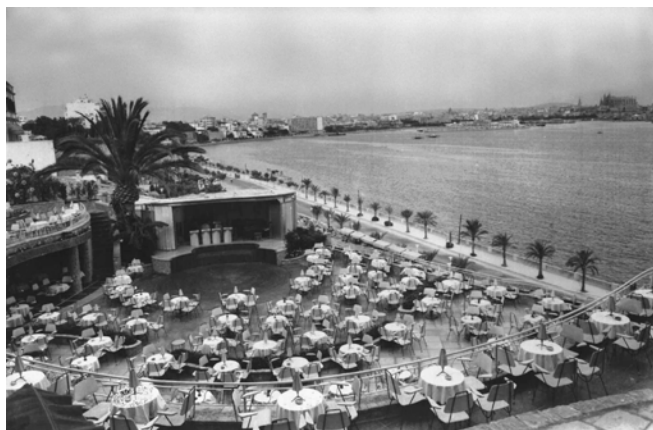
Tito's, ca. 1960.