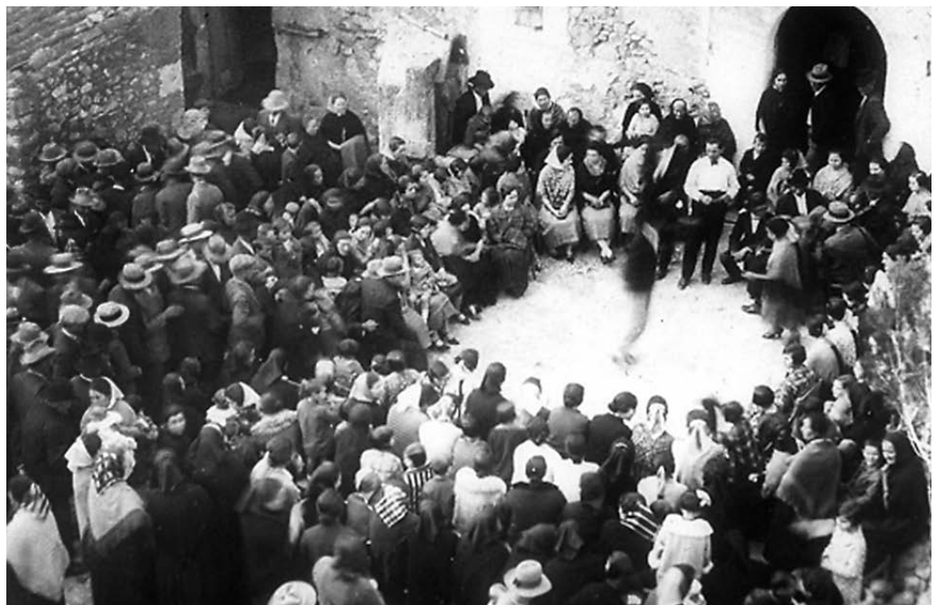
El cercle com a espai escènic primari i informal. Can Ros, Felanitx, 1917.

Quan aquesta catalogació es transforma en una gràfica temporal, podem veure que un gran nombre de teatres van ser inaugurats a principis del segle xx, un autèntic boom del moment teatral a Palma i a l'illa. Més que l'artística, una altra va poder ser la motivació per justificar la proliferació de teatres al començament del segle xx a Mallorca, i aquesta podria ser la vitalitat associativa. L'aspecte social i polític va provocar el boom de la construcció d'edificis teatrals a Mallorca.