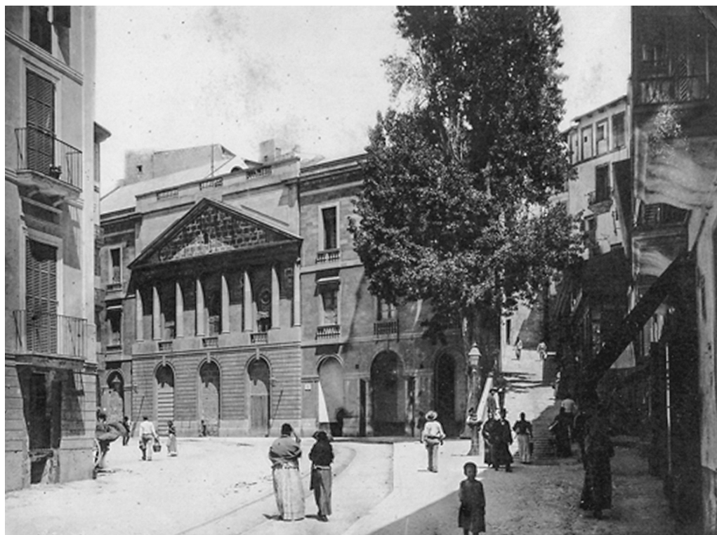
Teatre Principal, ca. 1880.