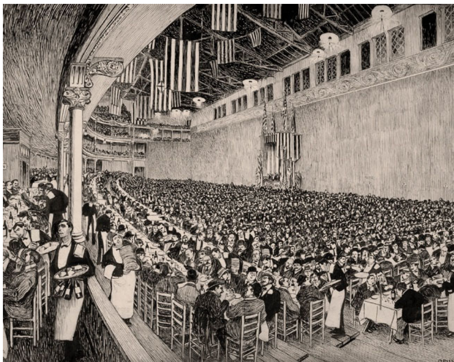
Fig. 3 – Il pranzo della vittoria . Ricard Opisso. Barcellona, 1905. MNAC

Nei diversi contesti lavorativi o istituzionali i pasti della giornata prevedevano il raduno dell'intero collettivo intorno al tavolo. Nel caso delle scuole, le fotografie in tempi diversi delle loro mense riflettono come i diversi sistemi pedagogici influenzassero sia le abitudini alimentari che la dimensione e l'organizzazione degli spazi. Particolarmente sensibili sono le immagini delle sale da pranzo «domestiche» delle «scuole attive» negli anni '30, dove i bambini si sedevano attorno ai tavoli organizzati in ambienti simili a quelli di una casa sotto l'occhio discreto degli insegnanti che mangiavano nello stesso spazio.