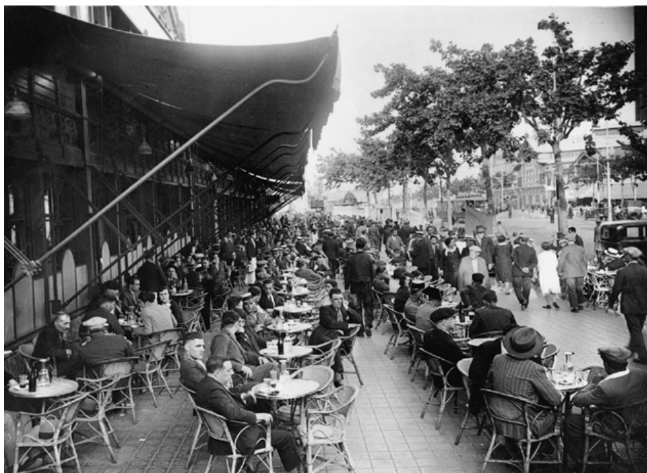
Fig. 2 – Caffè Español. Barcellona, 1930-1936.

Rompeolas, con folle informali, sedie pieghevoli, cesti e cibo, sono state raccolte in numerosi disegni e fotografie.