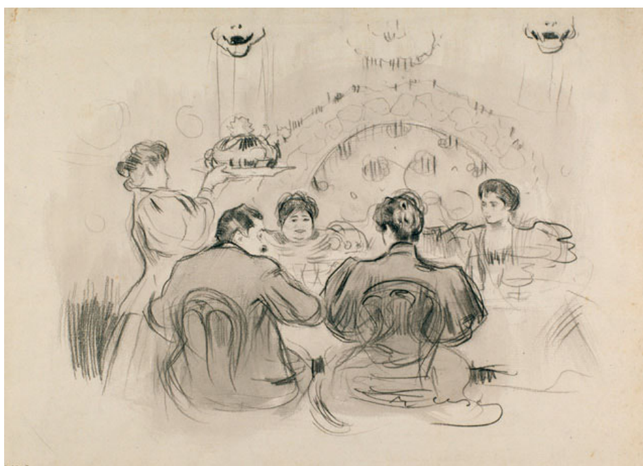
Fig. 4 – Pranzo di festa . Ramon Casas. Barcellona, 1898. MNAC

Attualmente, a causa della mancanza di tempo, della dispersione familiare e dell'avvento di modelli di vita diversi, più veloci e pratici, la routine di «apparecchiare» o i pranzi domestici celebrati in certe date con l'esibizione del miglior corredo, salvo meritevoli eccezioni, sono andate scomparendo dalle case di Barcellona.