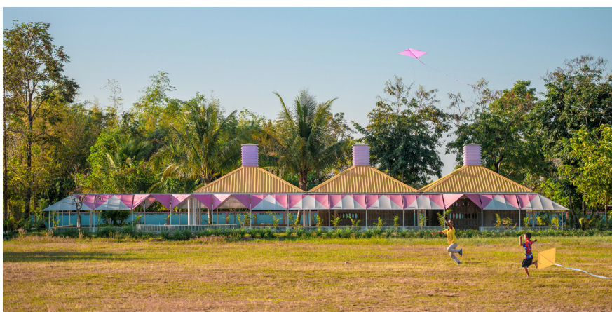
A Bang Nong Saeng, Pau Sarquella

Alumnos y profesores de la C tedra Blanca de los  ltimos 20 a os