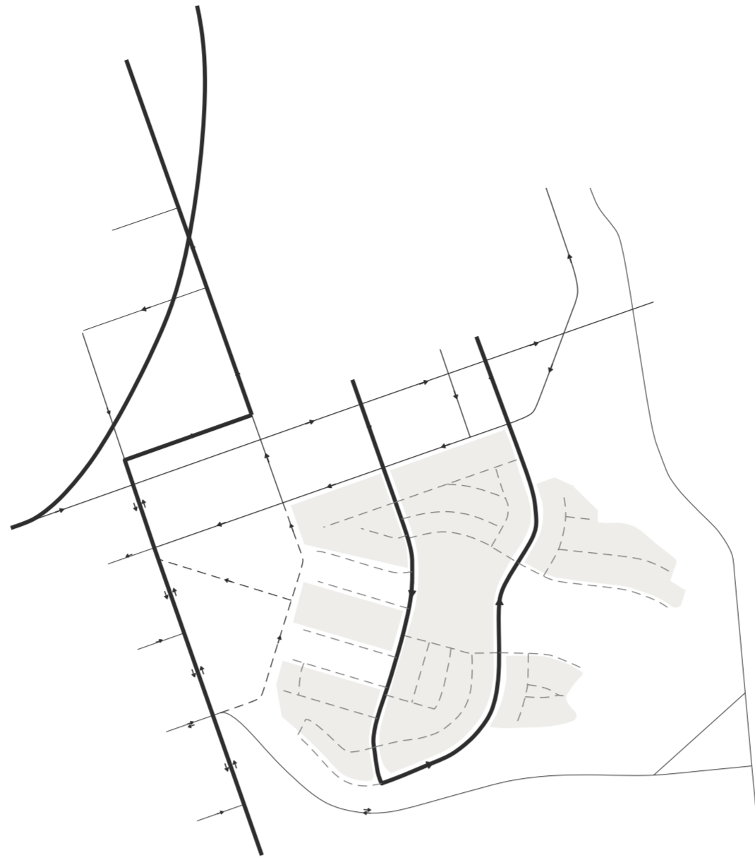
ESTUDI DE MOBILITAT