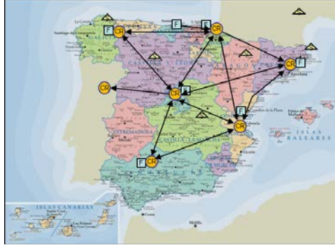
Fig. 1 Suministradores, fábricas y centros regionales

La producción de las fábricas se enviaba a 5 centros regionales (CR), desde los que se alimentaban 38 centros de distribución (CD), los cuales a su vez surtían a los puntos de venta. Adicionalmente, se había creado un CR en Portugal. El transporte a larga distancia se realizaba con el producto dispuesto en contenedores reutilizables, por lo que era necesario garantizar el retorno de los mismos (Fig. 1).