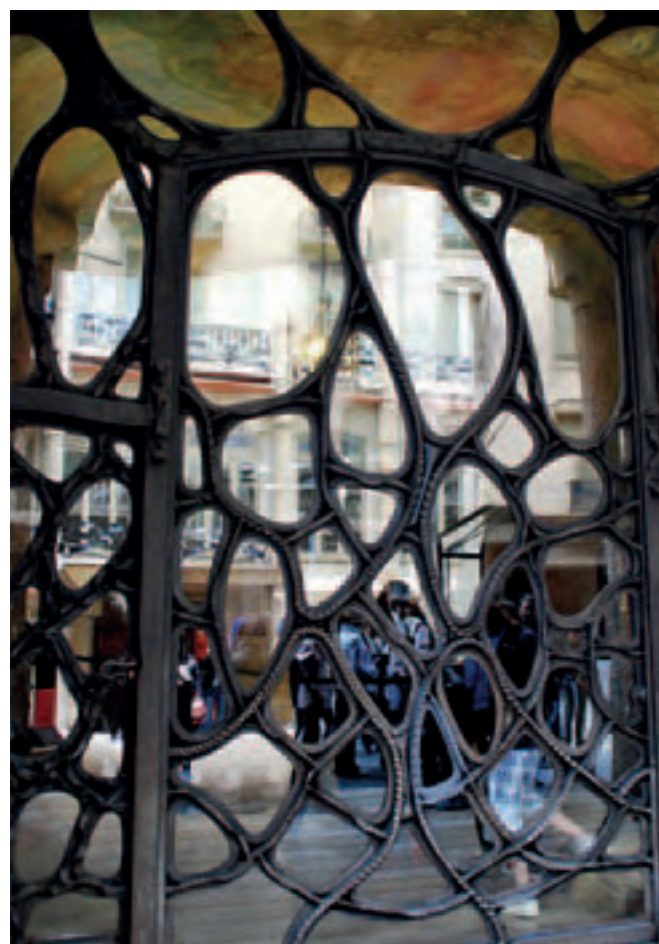
(Figura 6) Puerta del chaflán de "La Pedrera" (LGT).