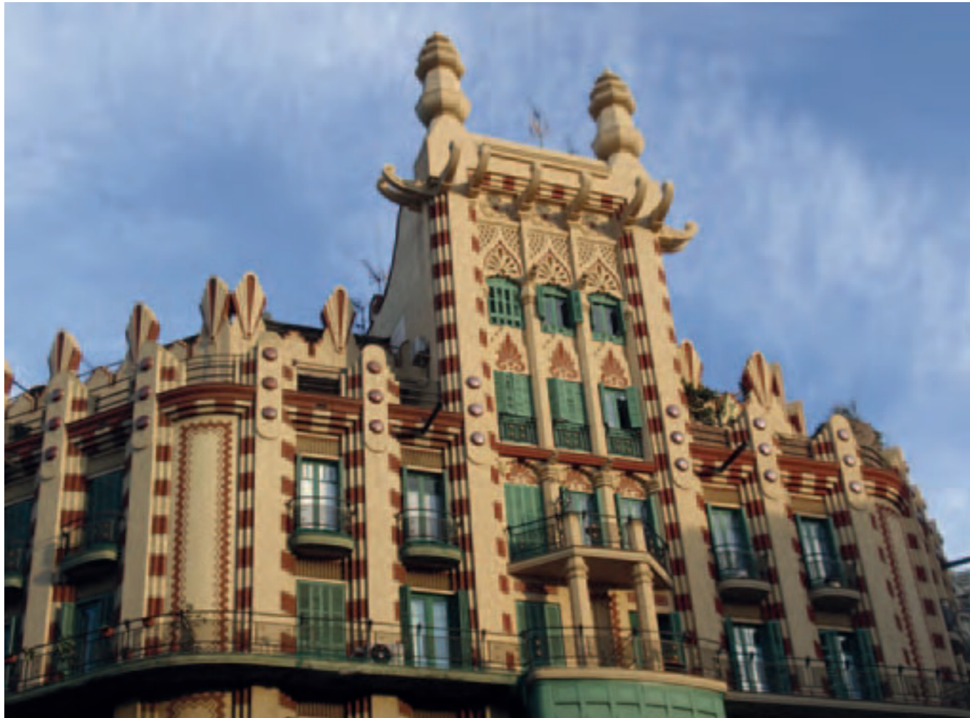
(Figura 9) Edificio proyectado en la calle Muntaner 54 (Barcelona), por Juan Gordillo Nieto (LGT).

ya que las piedras no tenían ángulos, ni siquiera formas regulares y tampoco contaban con ninguna medida exacta en los planos previos.