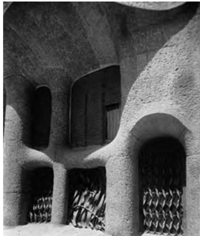
(Figura 2) Fotografía de época: semisótanos con rejas y persianas originales perfectamente encajadas en la obra de piedra.

Aunque el hecho de que no hubiese nacido en Reus o en el Camp de Tarragona iba en su contra, al menos era hijo de un maestro de obras y además y sobre todo, era nieto de carpinteros ebanistas.