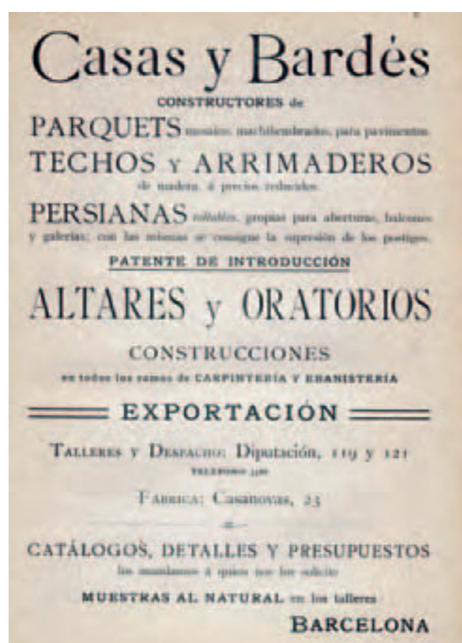
(Figura 7). Publicidad de la empresa Casas i Bardès dedicada a la fabricación de persianas.