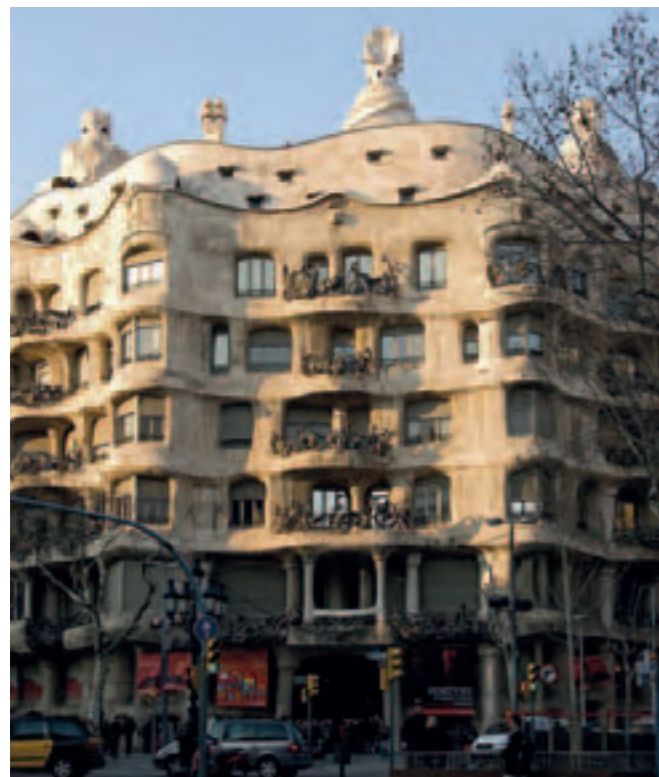
(Figura 1) Antonio Gaudí: “Casa Milá”.

meses de vida falleció su padre 2 . Era un maestro de obras que si hubiese vivido unos años más quizá podría haberle dado una preparación para lo que le depararía la profesión, pero que al dejarle huérfano le obligó a aprender todas las nociones básicas del complejo mundo de la construcción únicamente de sus maestros y profesores.