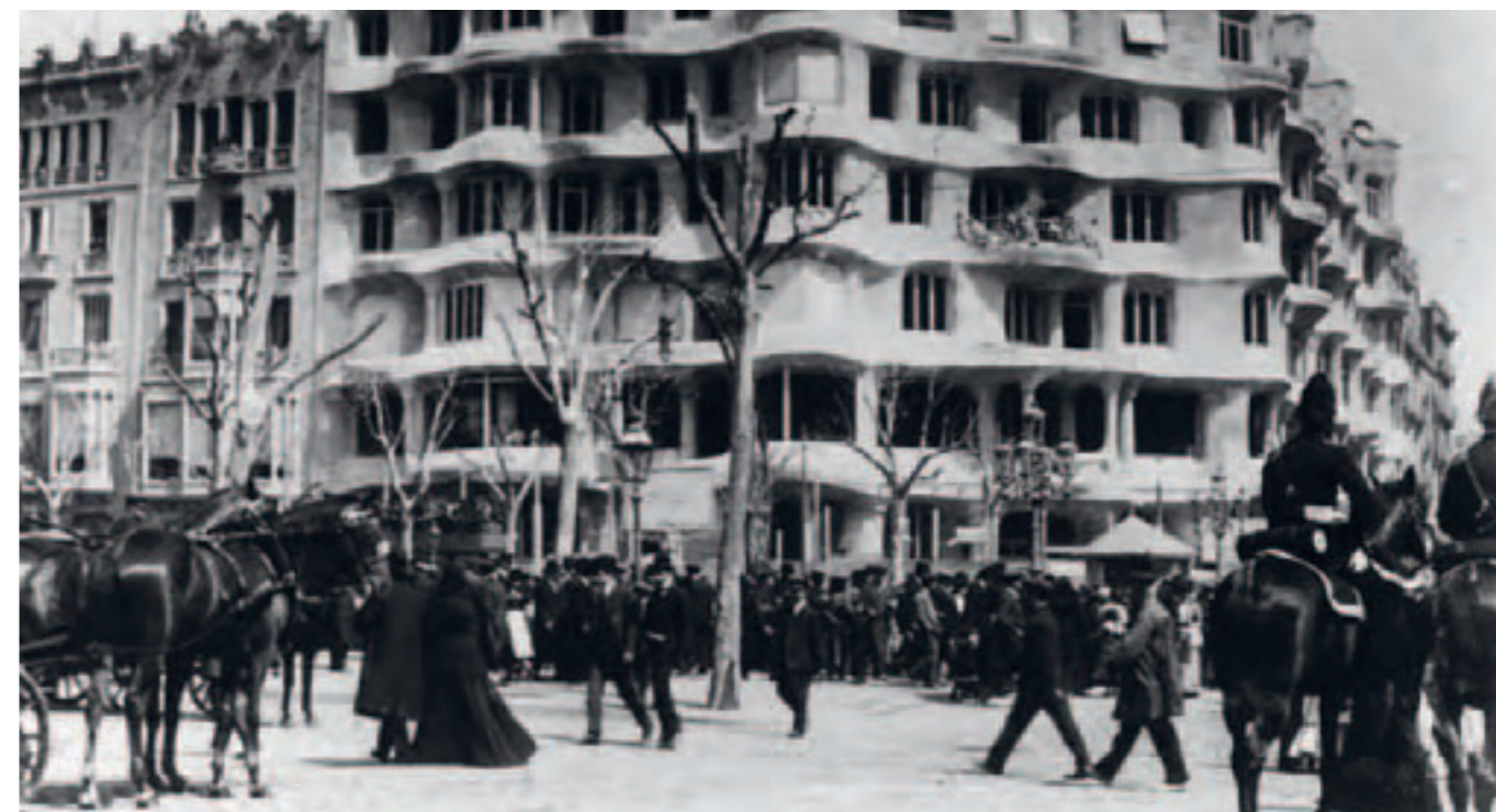
(Figura 8) Fotografía de época: Antonio Gaudí, "Casa Milá" (Barcelona), sin balcones.