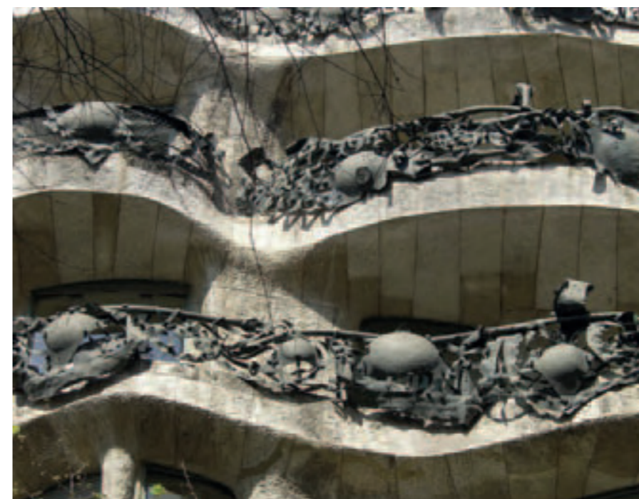
(Figura 3) Hierros del edificio en el Paseo de Gracia.