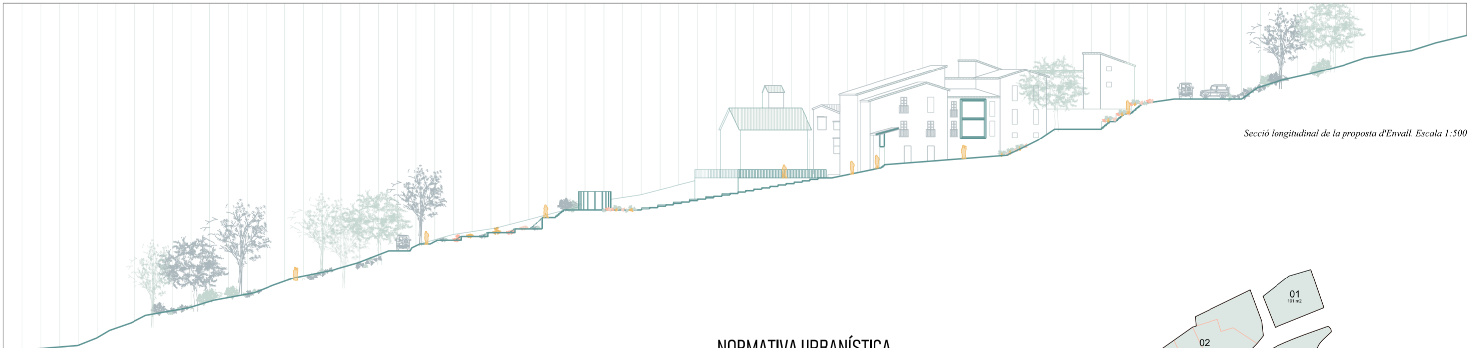
Secció longitudinal de la proposta d'Envall. Escala 1:500