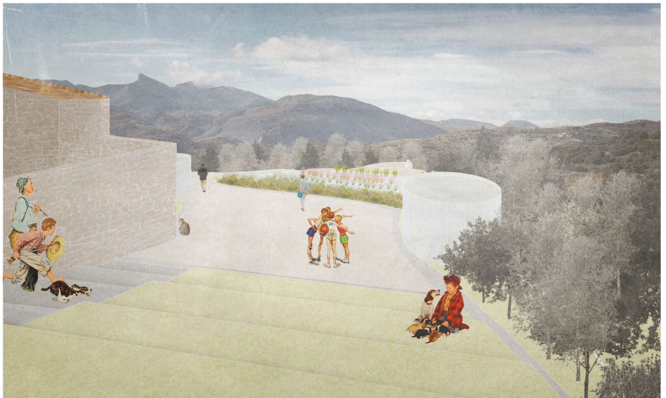
Vista de la proposta, de l'església cap als horts