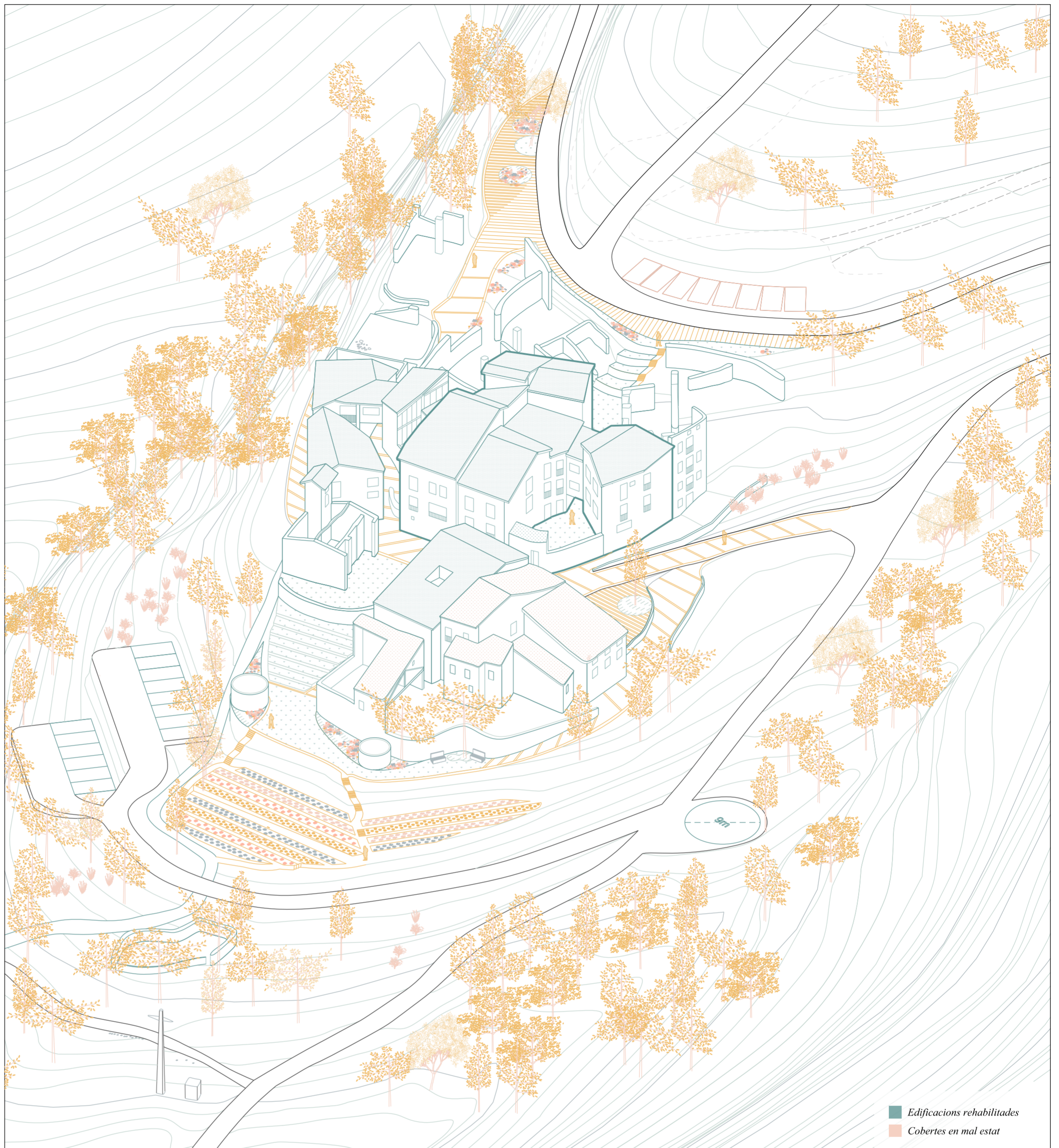
Axonometria amb proposta urbana i habitatges de la fase rehabilitats