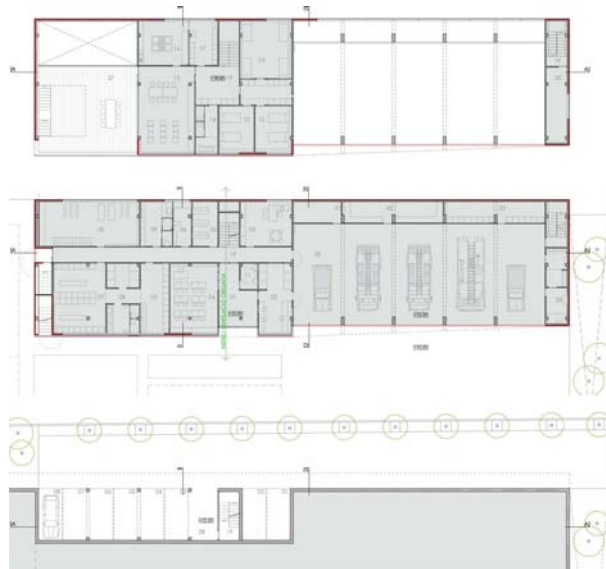
PLANTA -1, BAIXA I PRIMERA