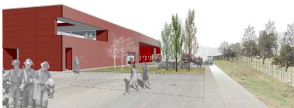
VISTA CARRER BATISTA