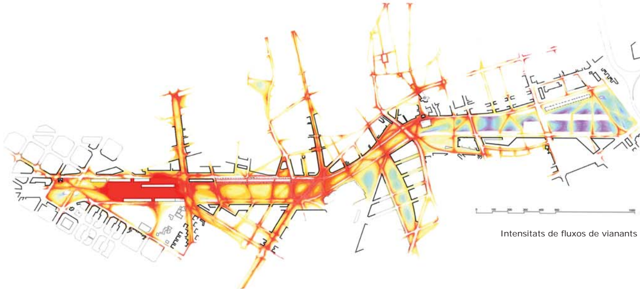
Intensitats de fluxos de vianants

Fruit d'aquestes consideracions concebem que una de les prioritats del nou parc serà resoldre aquesta ferida oberta i donar pas a una nova sutura en clau de connectivitat creant nous fluxos i recorreguts transversals, potenciant el reconeixement dels barris afectats i la reformulació d'un "continuum" urbà entre el nord i el sud.