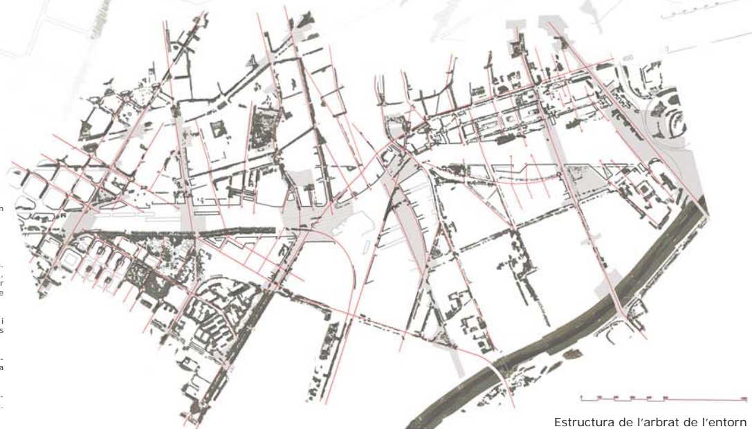
Estructura de l'arbrat de l'entorn

La voluntat d'aquest equip és de donar expressa continuïtat com a ampliació d'aquest corredor al tram que des del pont del carrer Espronceda, passant pel Parc del Clot arribi al nou escenari de la plaça de Les Glòries, on la futura proposta d'ordenació dona una nova vitalitat i harmonia horitzontal, si cal, a aquest enllaç. El paisatge dels grans eixos viaris no té topografia.