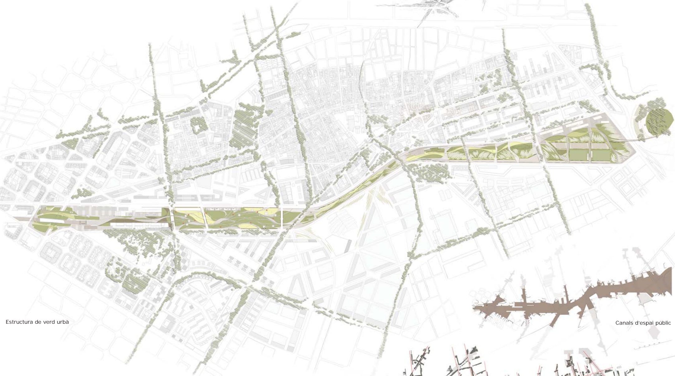
Estructura de verd urbà

Els itineraris són els que formalitzen els distints recorreguts i reforcen el teixit connectiu transversal. Des de qualsevol lloc del costat nord s'arribarà al costat sud. Els itineraris són venes, fibres, cordons i a la vegada generadors i intersticis plens d'activitats de present i futur.