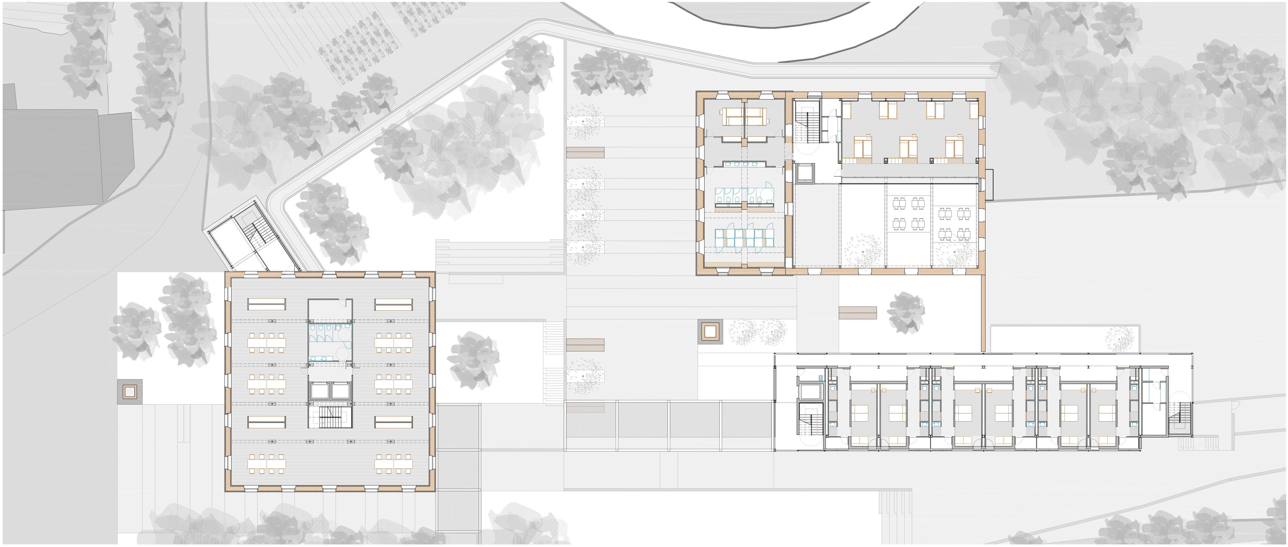
PLANTA SEGONA Nivell 02. +61,5m