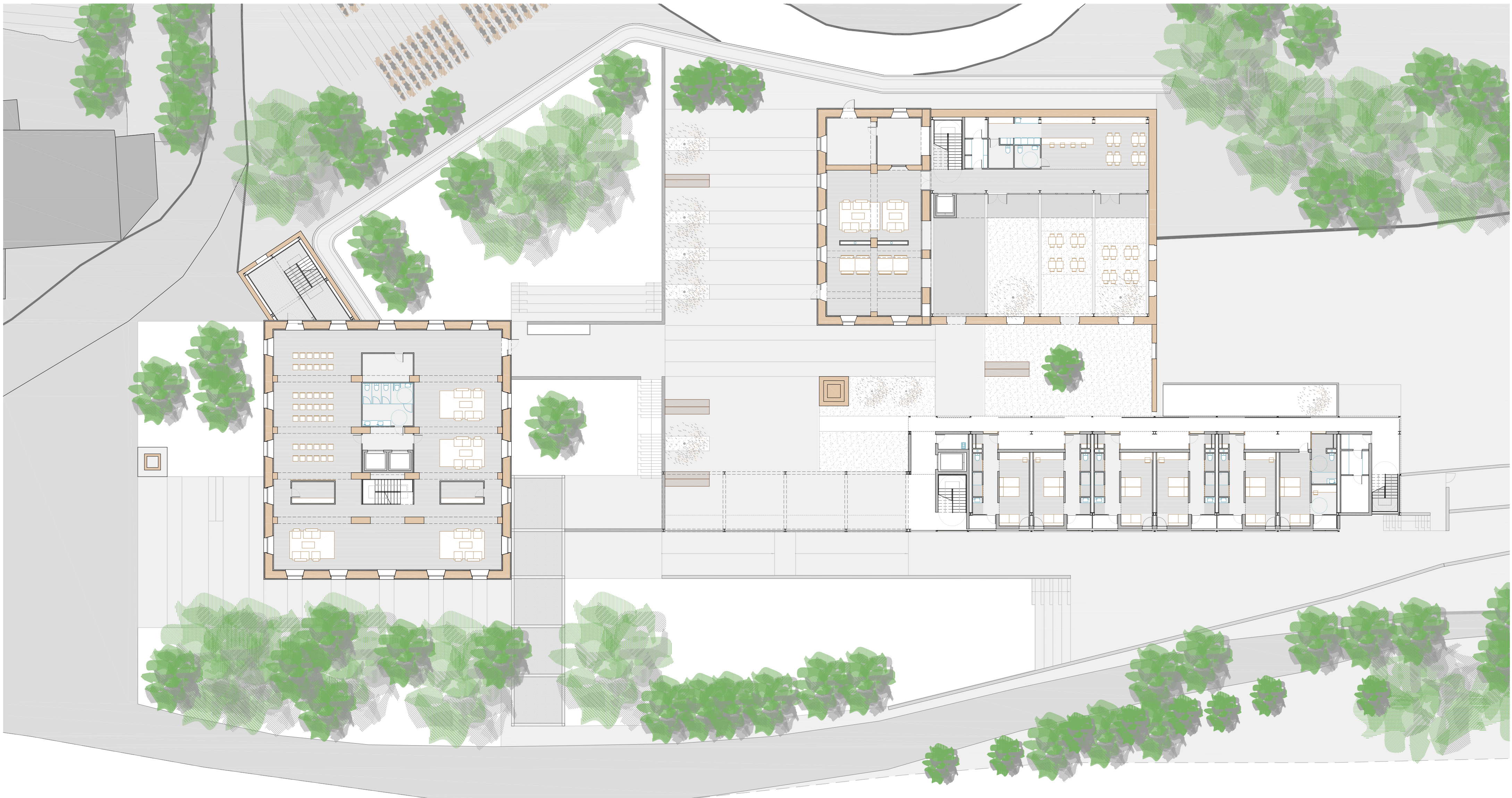
PLANTA PRIMERA Nivell 01. +56,5m