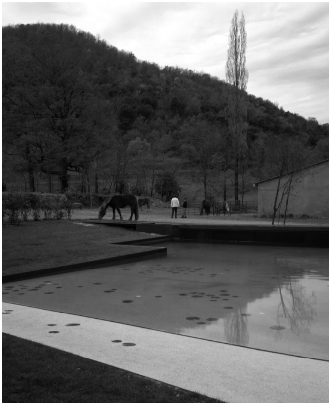
▲ Bassa a la Vila

Quin és el rol del programa a la vostra arquitectura? Aquelles cases del fuster, del ferrer, de la perruquera... semblen pensades per a oficis, definint l'habitant abans que un programa específic. Aquesta manera de fer és extrapolable a altres escales? Manipuleu l'enunciat a l'hora de projectar?