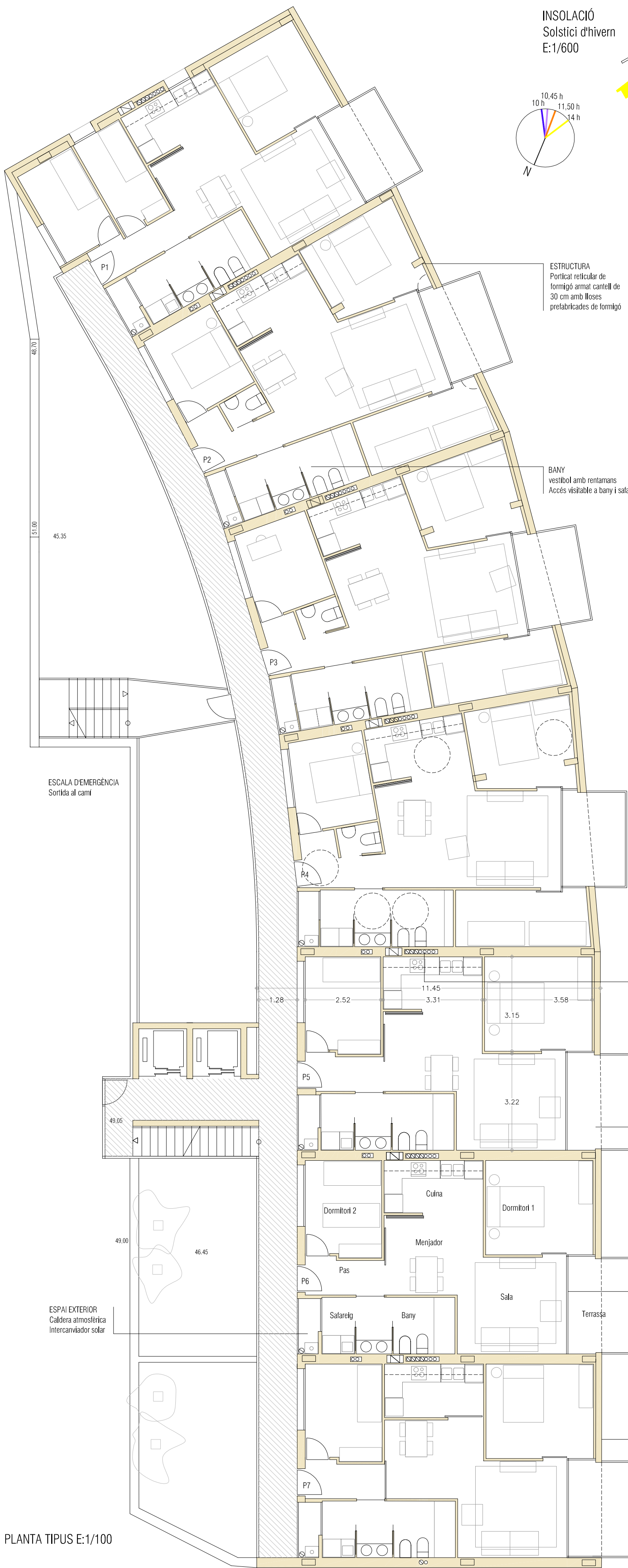
PLANTA TIPUS E:1/100