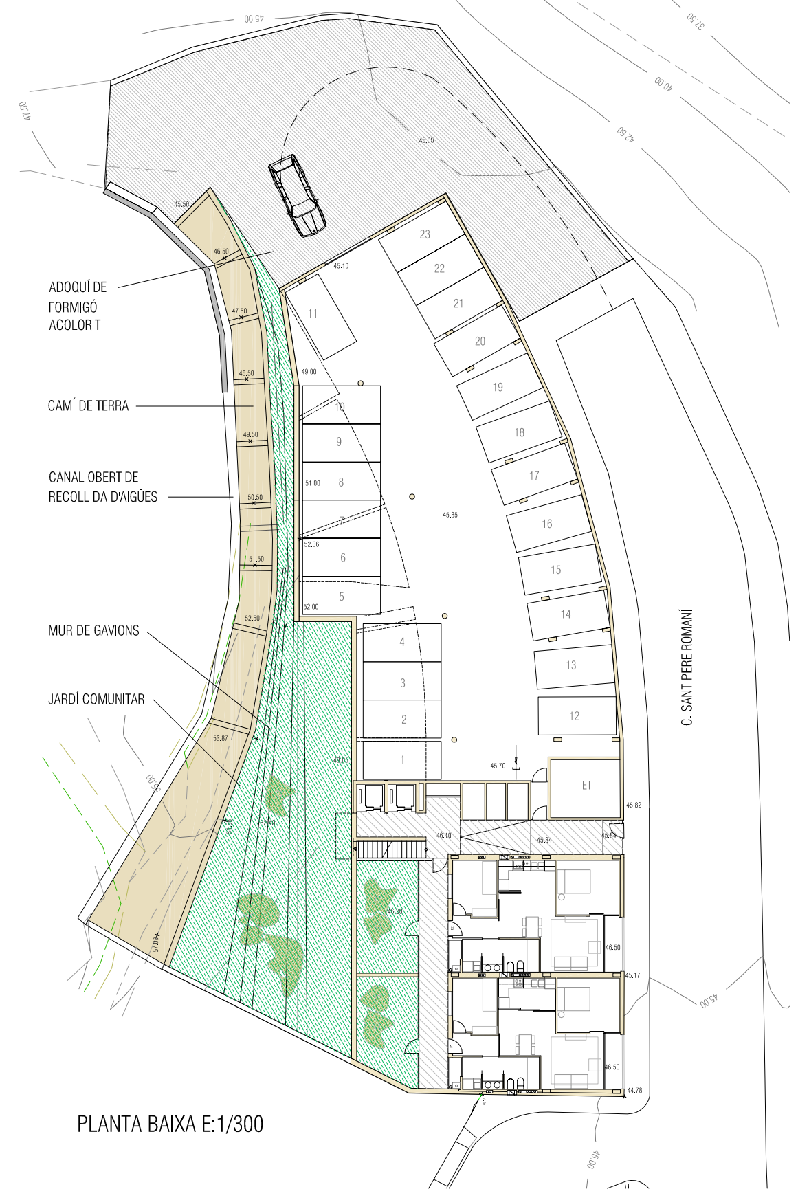
PLANTA BAIXA E:1/300