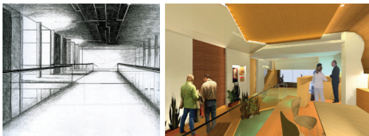
Fig. 5 Croquis y renders de iluminación. Trabajos de curso. CIS III. ETSAB

Actualmente fuera del aula se ofrecen un gran abanico de actividades educativas, entre las que destacamos los concursos, con una alta participación y una importante focalización temática que valora aquellas propuestas sugerentes, rigurosas y adaptadas a unas bases concretas y específicas.