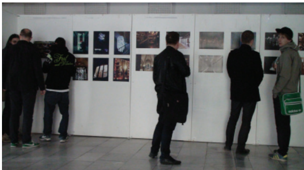
Fig. 8 Exposición en la universidad de Kosice, Polonia