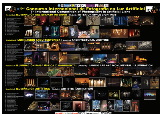
Fig. 1 Poster del 1ª edición del ICAL 2015

El concurso ICAL está organizado por el Taller de Estudios Lumínicos de la ETSA de Barcelona, UPC en colaboración con escuelas de arquitectura de Noruega, Polonia, Eslovenia, Eslovaquia. Es una plataforma que permite reflexionar sobre la luz artificial en la arquitectura desde varios puntos de vista: iluminación interior, arquitectónica, paisajística y monumental y artística. A este proyecto se sumaron más universidades a nivel internacional: la de Italia, Rumania y Méjico, y a nivel nacional: la de Madrid, Bilbao y la ETSA de Sevilla, formando parte de su organización o como miembros del jurado.