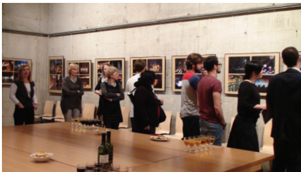
Fig. 9 Exposición en la universidad de Ljubljana, Eslovenia