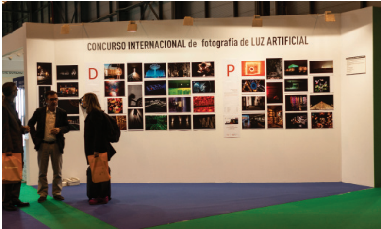
Fig. 12 Foto de la Exposición en el Salón LIGHTTECG Feria IFEMA de Madrid