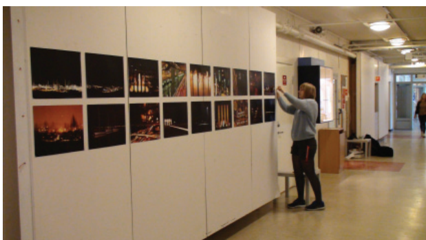
Fig. 10 Exposición en la universidad de Trondheim, Noruega