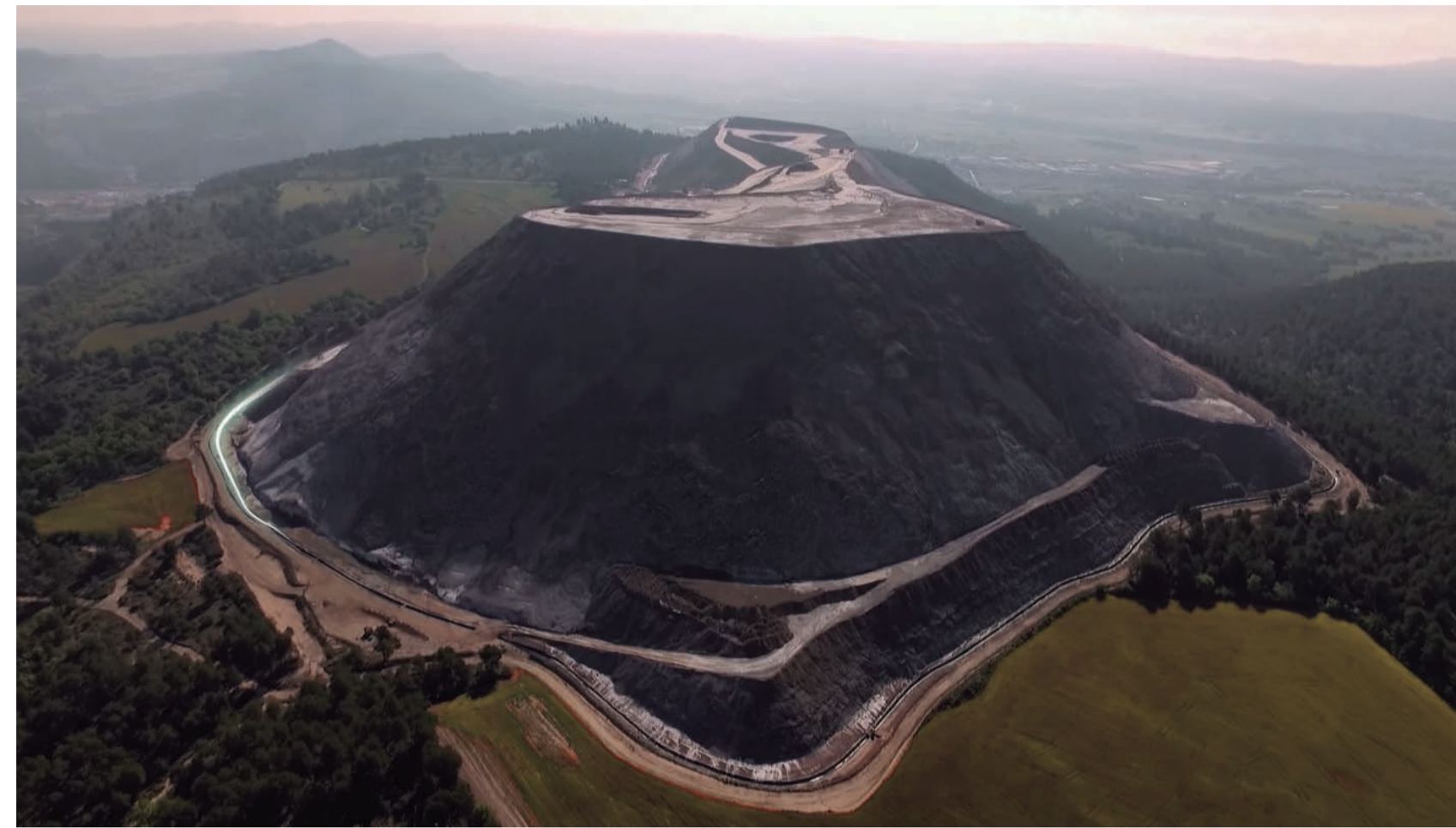
PROCESO DE DESMONTAJE Y PLANTACIONES DE SUAEDA

Otra opción posible sería impermeabilizar y mimetizar la montaña con una capa de sustrato natural, como el runam de Vilaforns, pero este sistema no deja de ser algo temporal supeditado a la vida útil del material impermeable.