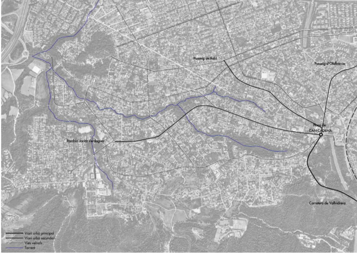
Xarxa viària interna