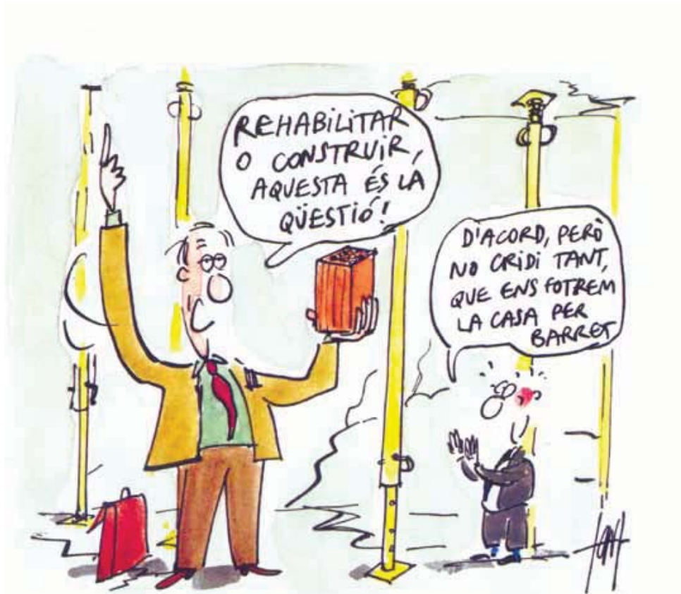
RECUPERANT LA IL·LUSTRACIÓ DE TONI BATLLORI, PUBLICADA L'ANY 94, CONSTATEM QUE LES CRISIS DEL SECTOR SÓN CÍCLIQUES. PER TANT, CONSIDERAR LA REHABILITACIÓ COM A SOLUCIÓ ECONÒMICA CONJUNTURAL ÉS UN ERROR I EL QUE CAL ÉS FER UNA REFLEXIÓ INTEL·LECTUAL I PROFUNDA DEL SECTOR

gran eufòria metropolitana, i a menys de dos anys de la inauguració dels Jocs Olímpics de Barcelona 92. Els barris populars, construïts amb presses durant el període del “desarrollisme”, semblava que eren una ruïna. La importància social del tema va interessar tots els mitjans, i l'alarma social es va desfermar. Les encara fortes associacions de veïns es van posicionar i van mobilitzar els veïns; els polítics van comprendre la magnitud del problema i es van abocar a donar respostes urgents a les demandes socials; i els tècnics es van posar al costat dels uns i dels altres per donar el recolzament necessari i fer front a una crisi d'aquestes dimensions. Tot plegat va portar a la rehabilitació i renovació de molts edificis del Turó de la Peira i de molts altres barris de Catalunya.