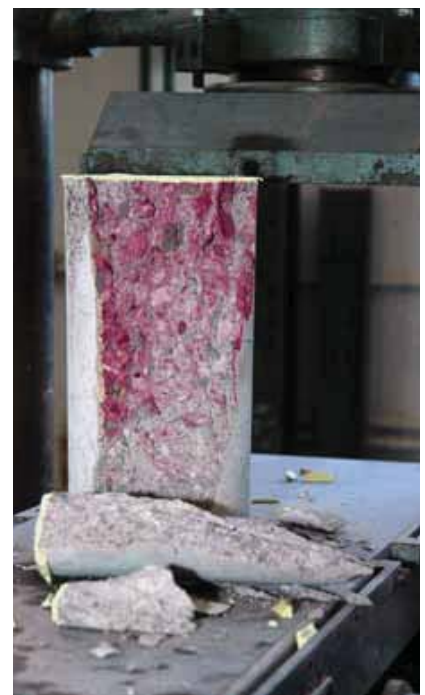
PROVETA CILÍNDRICA SOTMESA A UN ASSAIG DE RESISTÈNCIA A COMPRESSIÓ. ES POT OBSERVAR LA PART NO CARBONATADA AMB EL VIRATGE DE LA FENOLFALTEÏNA

cia d'aquests equívocs, són moltes les famílies que viuen en edificis en perfecte estat de conservació i que pateixen un neguit permanent des del moment en què un simple test aluminós determina que una (o diverses) biguetes del seu edifici van ser fabricades amb ciment aluminós. Inexplicablement, moltes altres famílies es neguen a acceptar una rehabilitació imprescindible per garantir la seva segu-