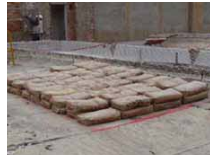
PER DETERMINAR LA SEGURETAT D'UN SOSTRE DE BIGUETES, SOVINT CAL PROCEDIR A VALORAR-LO EN CONJUNT, MITJANÇANT MODELS D'ANÀLISI MÉS O MENYS AJUSTATS, O A PARTIR DE PROVES DETERMINISTES ADAPTDES A CADA CAS.

present en els barris alts de Barcelona i en altres àrees benestants on els edificis són de millor qualitat. És curiós que en aquests casos no parlem d' aluminosi , sinó del fet que hi ha biguetes fabricades amb ciment aluminós.