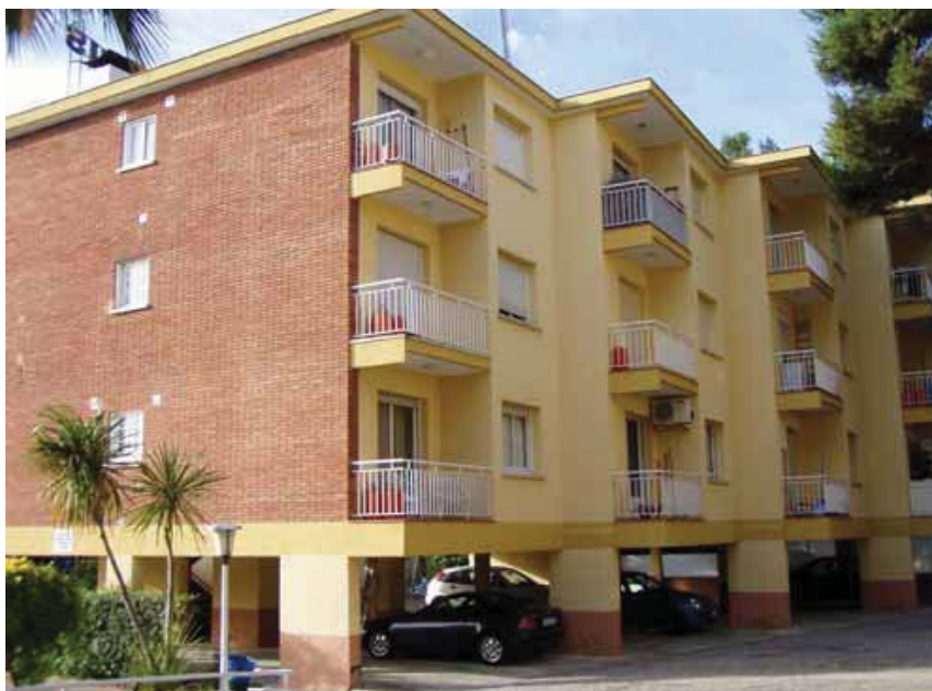
EDIFICI CONSTRUÏT AMB BIGUETES DE CIMENT ALUMINÓS PERÒ QUE PODRIEN SER DE PORTLAND, JA QUE LES LESIONS QUE TÍPICAMENT PRESENTEN ELS SOSTRES SÓN INDEPENDENTS DEL TIPUS DE CIMENT

retat i la de l'edifici, pel simple fet de no tenir biguetes fabricades amb ciment aluminós. Tot plegat, una greu i inacceptable contradicció.