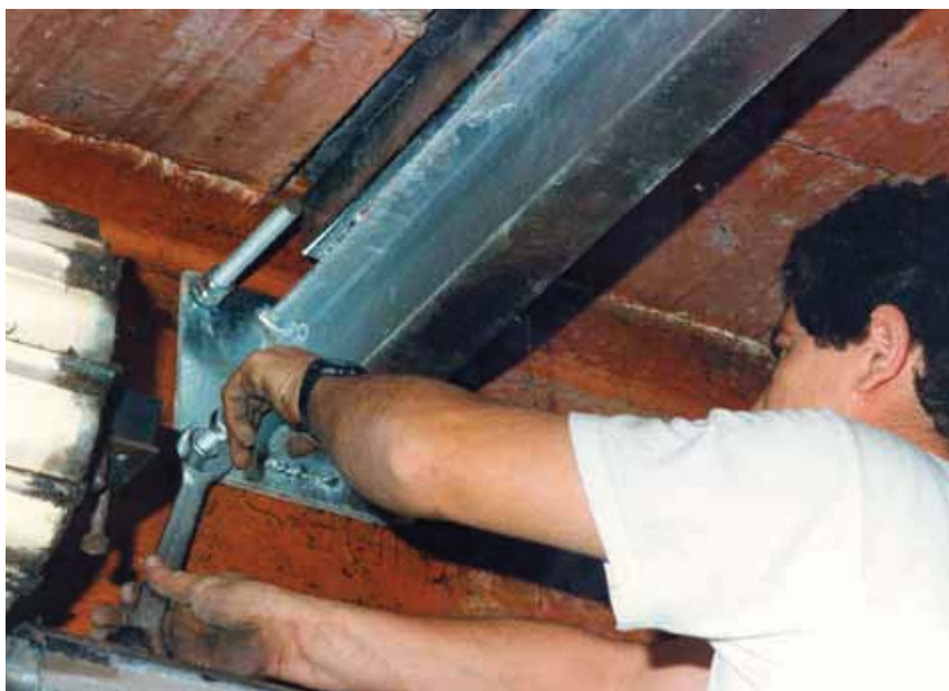
EL SECTOR INDUSTRIAL VA REACCIONAR MOLT RÀPIDAMENT AL PROBLEMA DE LA REPARACIÓ DE SOSTRES AMB SOLUCIONS MOLT PRÀCTIQUES I EFECTIVES, PER TAL DE FACILITAR LES OBRES

nyades de la realitat del problema. Amb els coneixements actuals, hem de desfer alguns tabús i malentesos que han sorgit i que sembla que es mantenen encara força vigents. Hi ha una certa tendència a simplificar, i sembla que han caigut en l'oblit tots els protocols d'inspecció i d'avaluació d'edificis que van sorgir a principis dels 90 i que situaven el seu objectiu en el bon coneixement dels edificis i tots els seus components. Pel que fa al comportament estructural dels sostres, sovint el model d'anàlisi presenta pitjors resultats que no pas el propi comportament demostrat al