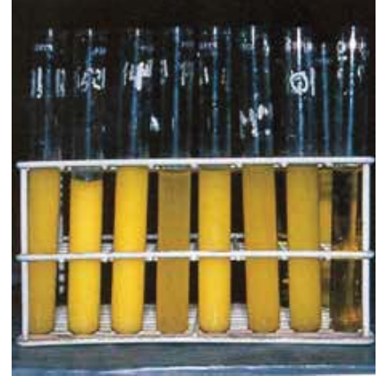
EL TEST ALUMINÓS QUE EL CAATB VA POSAR EN MARXA JUNTAMENT AMB LA UPC ARA FA 16 ANYS ÉS ENCARA VIGENT COM A EINA DE SUPORT AL TÈCNIC