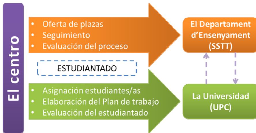
Figura 3.- Funciones principales y relaciones

En la Figura 3 se observa las funciones principales de los centros con la administración educativa y con la Universidad.