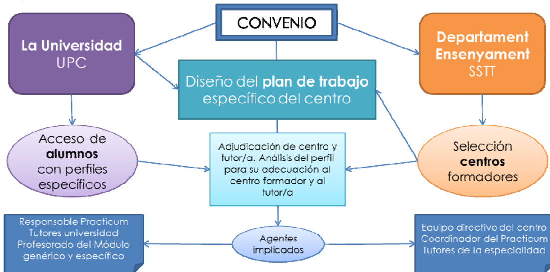
Figura 2.- Cuadro de relaciones

La práctica reflexiva es una metodología que desde la UPC vamos introduciendo en la asignatura del Practicum con el convencimiento claro de la fuerza de la misma para estimular un proceso de mejora continua. Ésta metodología, que parte de la práctica real en un contexto profesionalizador, promueve el cambio intrínseco a través de un proceso de reflexión individual y grupal sistematizado. El estudiantado del Máster tiene que recoger en su portafolio un ciclo reflexivo de una actuación realizada en sus prácticas de intervención autónoma.