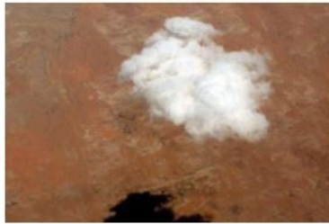
Cloud and shadow over Earth

dinàmica necessària per la consolidació present i futura del lloc com a component únic i arrelat a l'estructura i en l'imaginari de la ciutat.