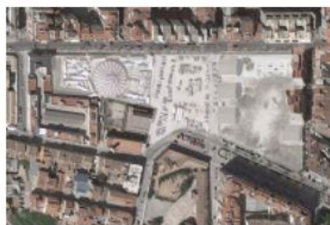
Plan of the site

Així, la nostra resposta al tema principal del concurs "plantejar un centre de la innovació, per a les activitats productives de la ciutat" assumia la necessitat d'entendre les formes de producció de manera innovadora. Amb aquest objectiu, vam plantejar la urgència de proposar espais capaços d'incubar i estimular noves formes de relació. La nostra forma d'entendre el concepte de progrés, desenvolupament i creixement en termes econòmics i socials no s'alinea amb les demandes i ofertes del mercat productiu capitalista, sinó que s'enfoca a l'estímul del pensament crític, la creativitat, l'empatia, la col·laboració i la intel·ligència col·lectiva, prenent aquests conceptes com a motor de projecte.