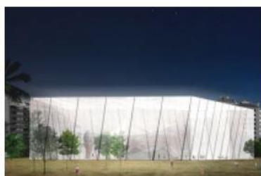
The atmospheric artefact

Amb aquest objectiu, la proposta presentada es fonamenta en referències teòriques i expressives que exploren aquests aspectes. En primer lloc, el fet d'entendre el pensament innovador com un comportament social, col·lectiu i públic, així com una ocupació de temps en sí mateix, ha estat descrit per la filòsofa Marina Garcés en alguns dels textos que recull el llibre "Fora de classe" (Arcàdia, 2016). En segon lloc, són referents les discussions sobre la solidesa objectual i la materialitat introduïdes per Gyorgy Kepes a "Art and ecological awareness" (1972), així com algunes referències de recerca de materials i experiències atmosfèriques on la conviuen la col·lectivitat i la introspecció de manera simultània en espai i temps, com és el cas de "Dome over Manhattan" (Buckminster Fuller & Shoji Sadao, 1960), "Restless sphere" (Coop Himmelbau, 1852) i "Mobile office performance" (Hans and Lilly Hollein, 1852) entre d'altres. Finalment, en la recerca de noves experiències col·lectives, d'apreciació urbana i creativitat on els espais arquitectònics s'empren de suport, el llibre "The city as loft" de Martina Baum i Kees Christiansee (2013) aporta un àmplia gamma de casos i criteris.