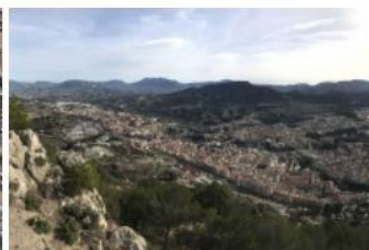
Aerial view of Alcoy