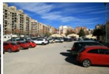
General view of the urban void

Aquesta voluntat es materialitza gràcies a les característiques de l'entorn i la pròpia condició impulsada per la municipalitat: la necessitat de caracteritzar i referenciar un gran buit urbà per identificar-lo com a nou Innovation Hub, i, al mateix temps, consolidar la plaça Al-Azarq com un punt de connexió entre el verd i l'estructura urbana. La preexistència d'edificis residencials d'alta densitat i altura empeny la proposta a prendre una formalització d'una escala igualment potent: una gran estructura buida, a escala d'illa, que permet no només definir i qualificar una atmosfera interior (buida), sinó que també genera un volum amb força suficient per establir un diàleg amb el teixit de l'emplaçament, amb prou entitat a escala urbana. Una atmosfera interior pública, comuna, transparent, generosa i flexible, sobre un pla continu i equipat que vincula espais interiors i exteriors, diluint els límits entre carrer, parc, equipament i espais productius, i on tecnologia i infraestructura donen suport i estimulen diferents formes d'ocupació, apropiació i ús de l'espai. La recerca d'urbanitat, d'identitat i identificació aquí s'interpreta amb la proposta d'un espai de possibilitat, on l'articulació d'obertura i representació proveeixen l'estabilitat