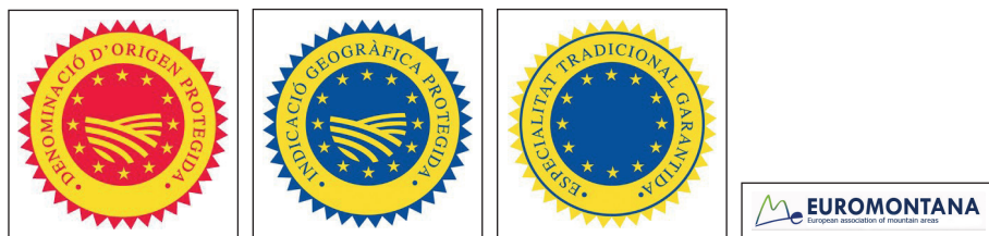
FIGURA 1. Els logos de les tres principals marques geogràfiques europees i el de l'única menció de qualitat facultativa que s'ha concedit fins al moment