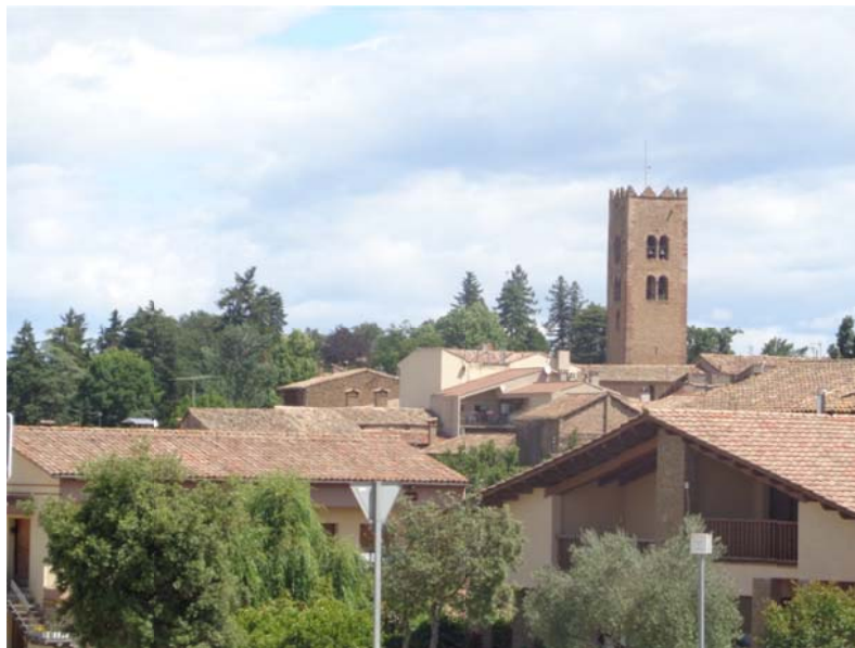
Imatge 5. El campanar romànic de Santa Maria de Seva serveix de referència a la població

La primera data històrica de Santa Maria de Seva apareix en un document de compra venda de vinyes l'any 952. El que resta de l'antic temple romànic és la façana i l'inici del presbiteri (18 metres de nau). L'original església romànica es va modificar per convertir-la en un temple de planta de creu llatina, tot i que al mur sud encara es conserva un fris d'arcuacions cegues. Al segle XVII malauradament fou suprimit l'absis, es van construir unes capelles laterals prop del presbiteri i es va sobrealçar el temple. L'interior es troba totalment renovat, sense mantenir cap origen romànic. L'any 1915 es va fer la portalada neoromànica.