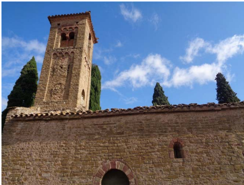
Imatge 2. Façana sud, amb la porta original, de Sant Jaume de Viladrover

Sant Jaume va ser una sufragània de Sant Martí del Brull fins al segle XIX, moment en que va esdevenir parròquia. La primera notícia documental del temple data del 1029. Originàriament de propietat privada, al 1372 va ser venuda al canonge vigatà Pere Berenguer. El 1685 va ser renovada per complet la volta i el 1689 es va construir una capella a tramuntana. El 1926 va ser novament reformada amb la prolongació de la nau i la construcció de l'absis.