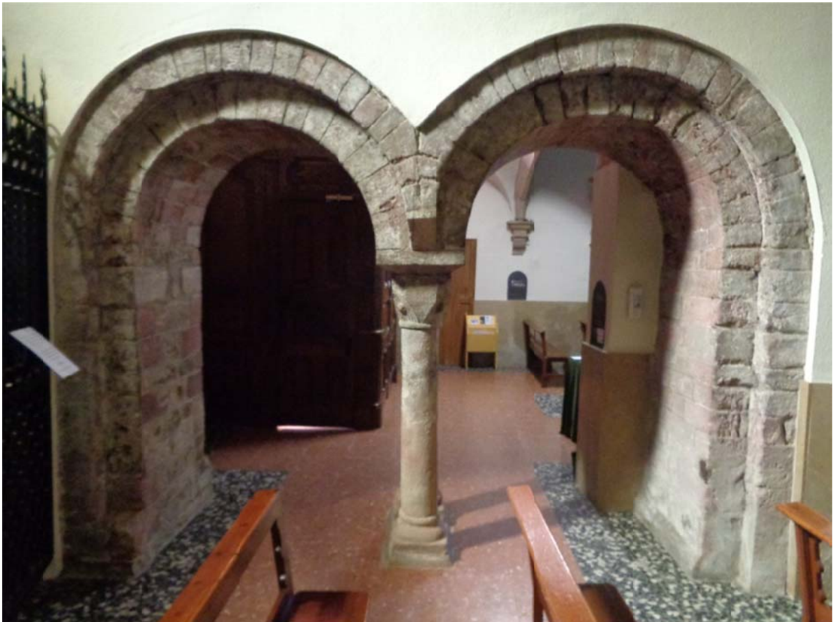
Imatge 4. L'únic que resta de l'original església romànica de Sant Martí de Viladrau

L'església apareix documentada per primer cop l'any 908 8 , quan Pere i la seva muller Francoberta venen a Argila i a la seva muller Elisia unes terres de regadiu a la parròquia de Sant Martí. El topònim de Viladrau serà posterior i no apareix fins 1042, amb un acta notarial amb el nom de Sant Martí de Vilaredral . La parròquia de Sant Martí de Viladrau formava part del domini del Castell de Taradell. L'antiga església va ser consagrada per Berenguer Sunifred de Lluçà l'any 1082.