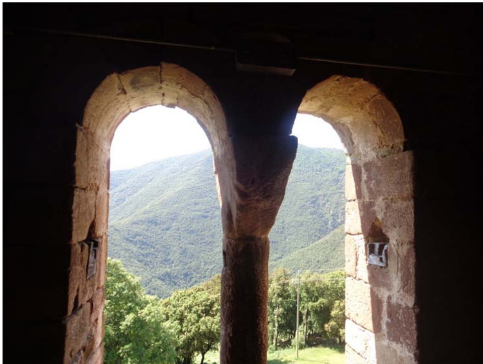
Imatge 3. Sant Cristòfol de la Castanya, des del seu campanar es domina tota la parròquia

La Castanya mai havia estat parròquia, sinó que depengué des dels seus orígens de Sant Martí. Es tenen notícies documentals d'aquesta església des de 1025, tot i que va ser consagrada el 1082 7 pel bisbe de Vic Berenguer Sunifred de Lluçà. Al seu interior es conservava un retaule fet expressament pel pintor Bertran Badia, que va ser posteriorment substituït per un altre de barroc.