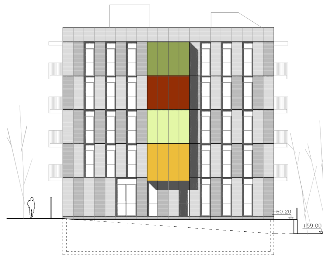
FAÇANA NORD-OEST. E 1:200