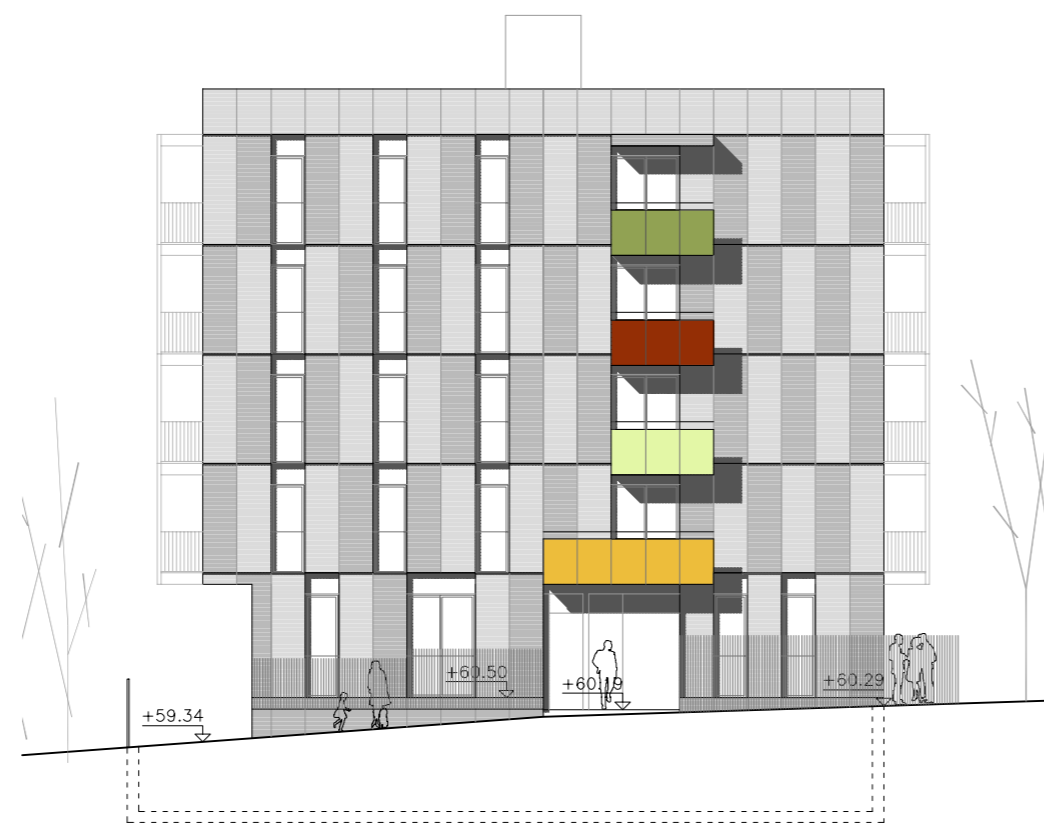
ACCÉS - FAÇANA AV. MONTSERRAT - NORD-EST. E 1:200