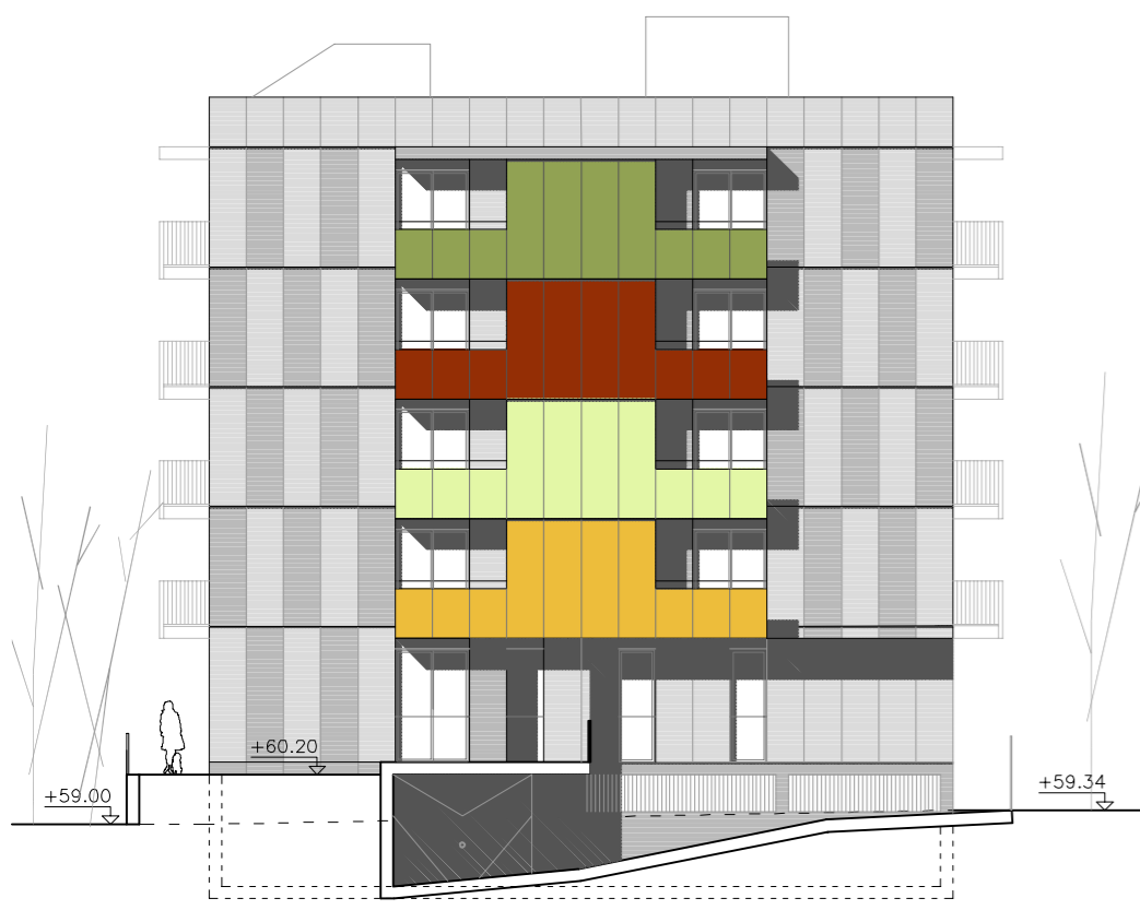
FAÇANA SUD-EST. E 1:200