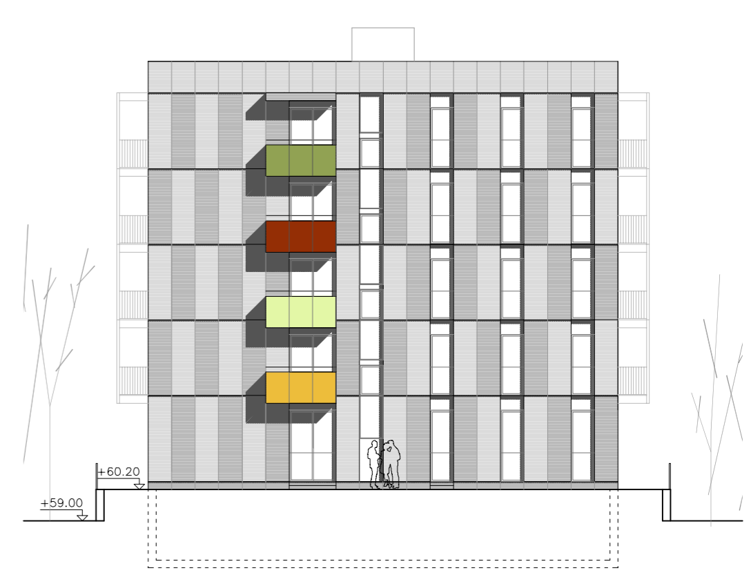
FAÇANA SUD-OEST. E 1:200