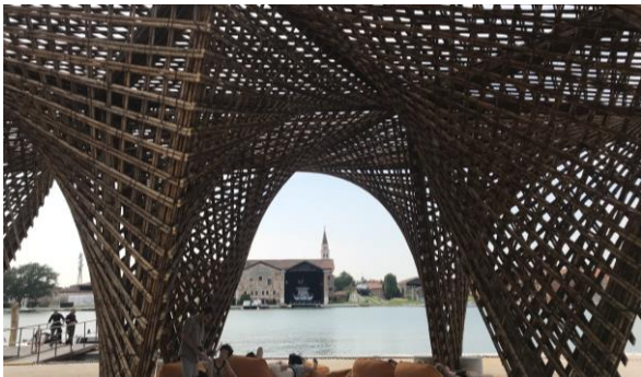
Figura 2. Bienal de venecia 2018. Imagen propia.

Por lo que cada vez, se realizan diseños paramétricos usando el bambú como material principal.