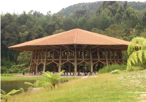
Figura 4. Réplica del pabellón Zeri, Manizales, Colombia.

Arquitectos reconocidos internacionalmente han resuelto el nudo en diferentes formas, Simón Vélez, uno de los principales arquitectos que se ha destacado por obras emblemáticas con bambú, la más conocida, el Pabellón Zeri (Fig. 4) en Alemania, donde el bambú es el protagonista de los materiales, mostrando sus cualidades y las altas prestaciones físico-mecánicas, de diseño, y flexibilidad como material para poder ser aplicado en cualquier tipo de construcción, resuelve el nudo con varillas roscadas, donde rellena los entrenudos con mortero para reforzarlo, esto lo hace para realizar claros de gran longitud y también para tener mayor resistencia de compresión en las uniones de columnas.