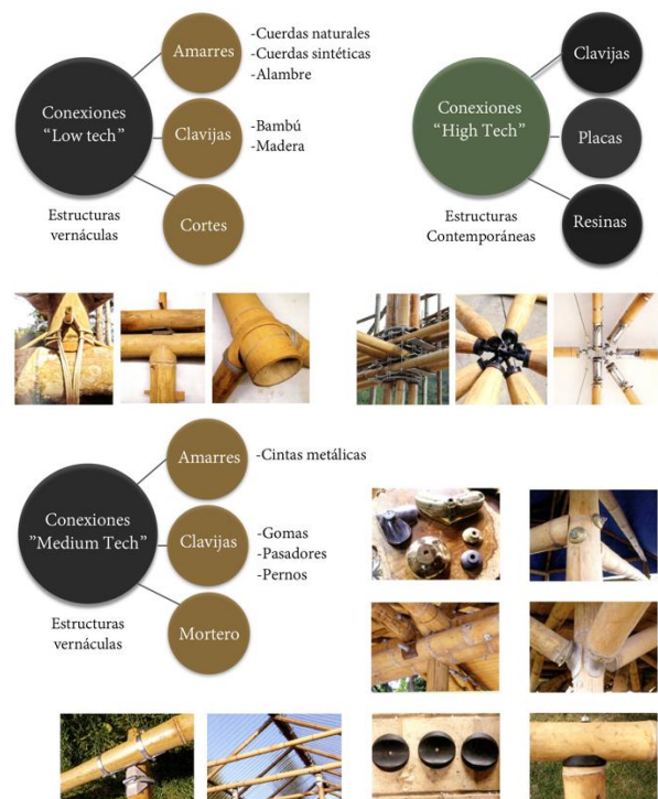
Figura 3. Tipología de conexiones en estructuras vernáculas y contemporáneas. Imagen: varios autores.

Conexiones “High Tech”: se desarrollan para una construcción en específico, la mayoría se usan en construcciones efímeras y muchas de ellas no son reutilizadas, son de aleaciones metálicas reforzadas con mortero y adhesivos.