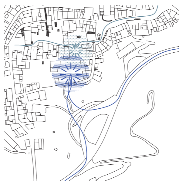
DIAGRAMA RELACIÓ DEL PROGRAMA - MUNICIPI

Un cop ja establertes entre si les relacions entre el programa, realitzem el mateix exercici a una escala superior. Busquem las relacions programa-parcela, parcela-municipi per diposar de la millor manera possible els paquets del programa previamente definits.