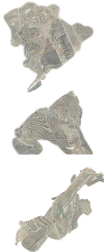
CONCEPTE DE FORMA DEL TERRITORI

El Priorat: terra de vinyes. El concepte de forma del territori està molt condicionat per la agricultura. El paisatge, en la seva majoria està replet de feixes de forma orgànica, adaptant-se al terreny, necessaries per el cultiu de les vinyes. Com a preambul del projecte volem remarcar aquest concepte.