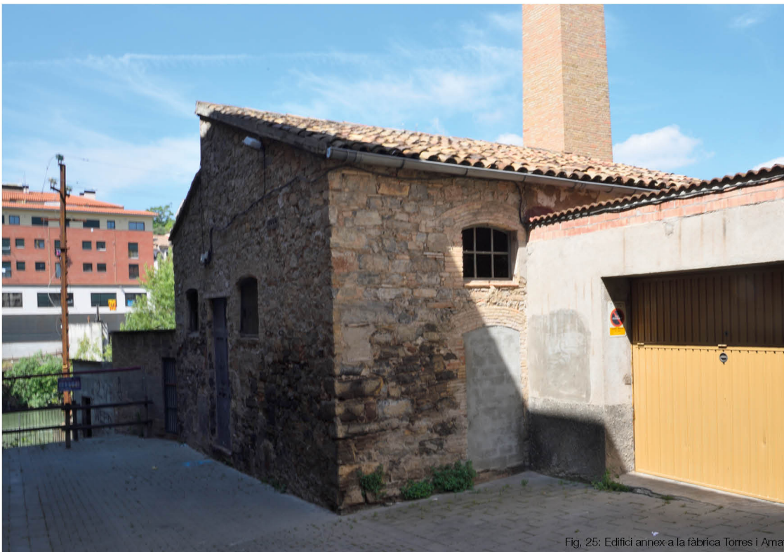
Fig. 25: Edifici annex a la fàbrica Torres i Amat

Actualment l'edifici és propietat de l'antiga mestressa de la fàbrica de Torres i Amat, el qual va ser un regal quan la fàbrica va tancar. Ara l'edifici és un espai d'emmagatzematge del hort i un petit taller que utilitza el fill de la propietària.