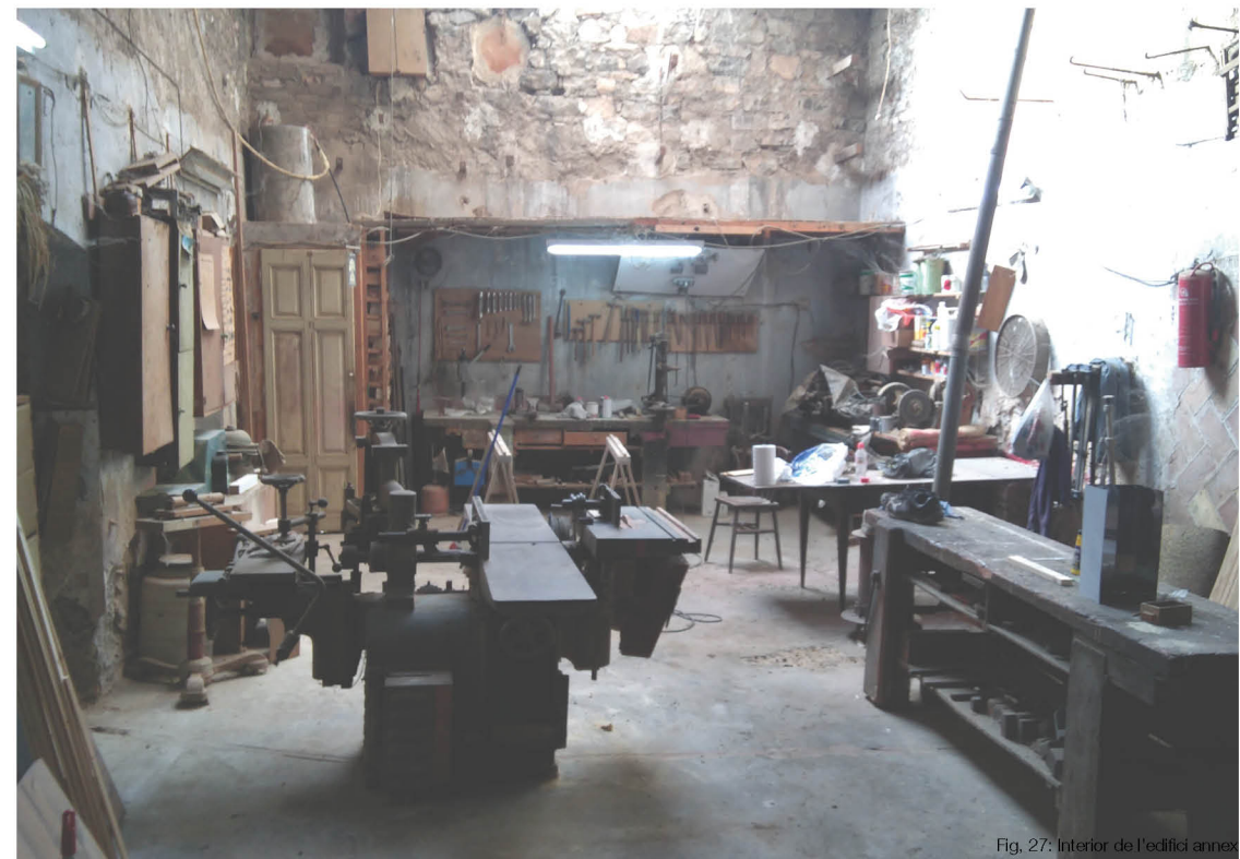
Fig. 27: Interior de l'edifici annex