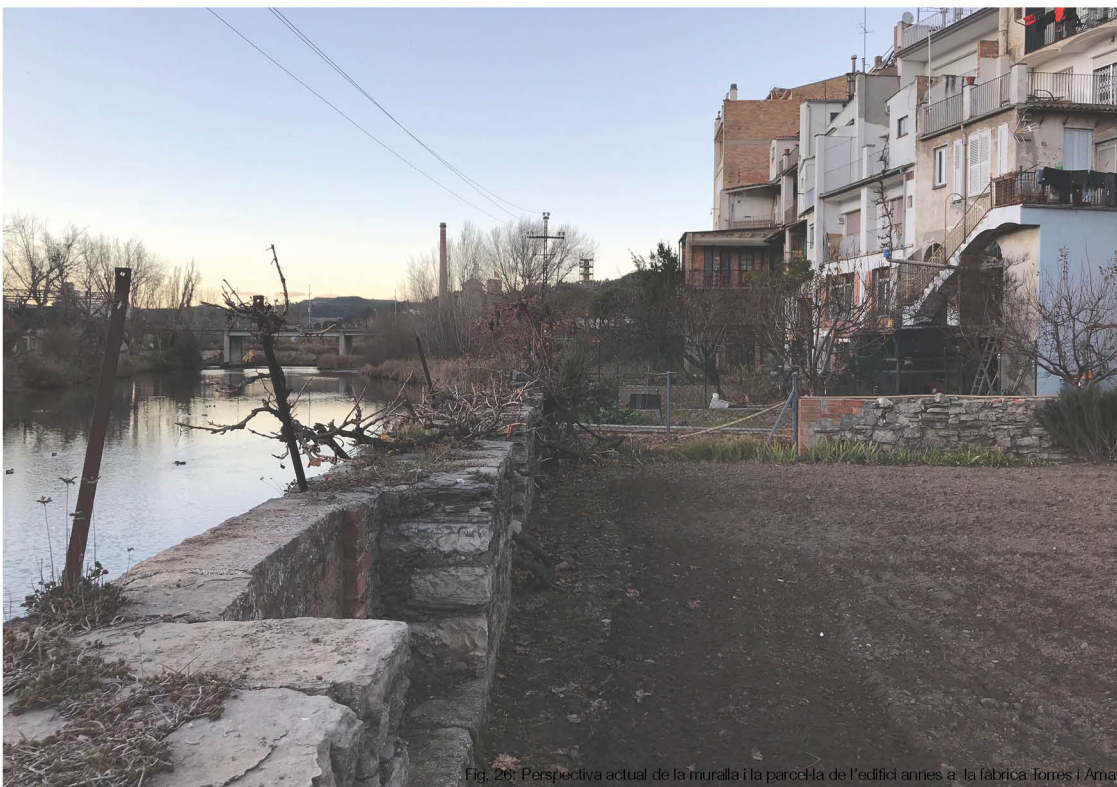
Fig. 26: Perspectiva actual de la muralla i la parcel·la de l'edifici annex a la fàbrica Torres i Amat