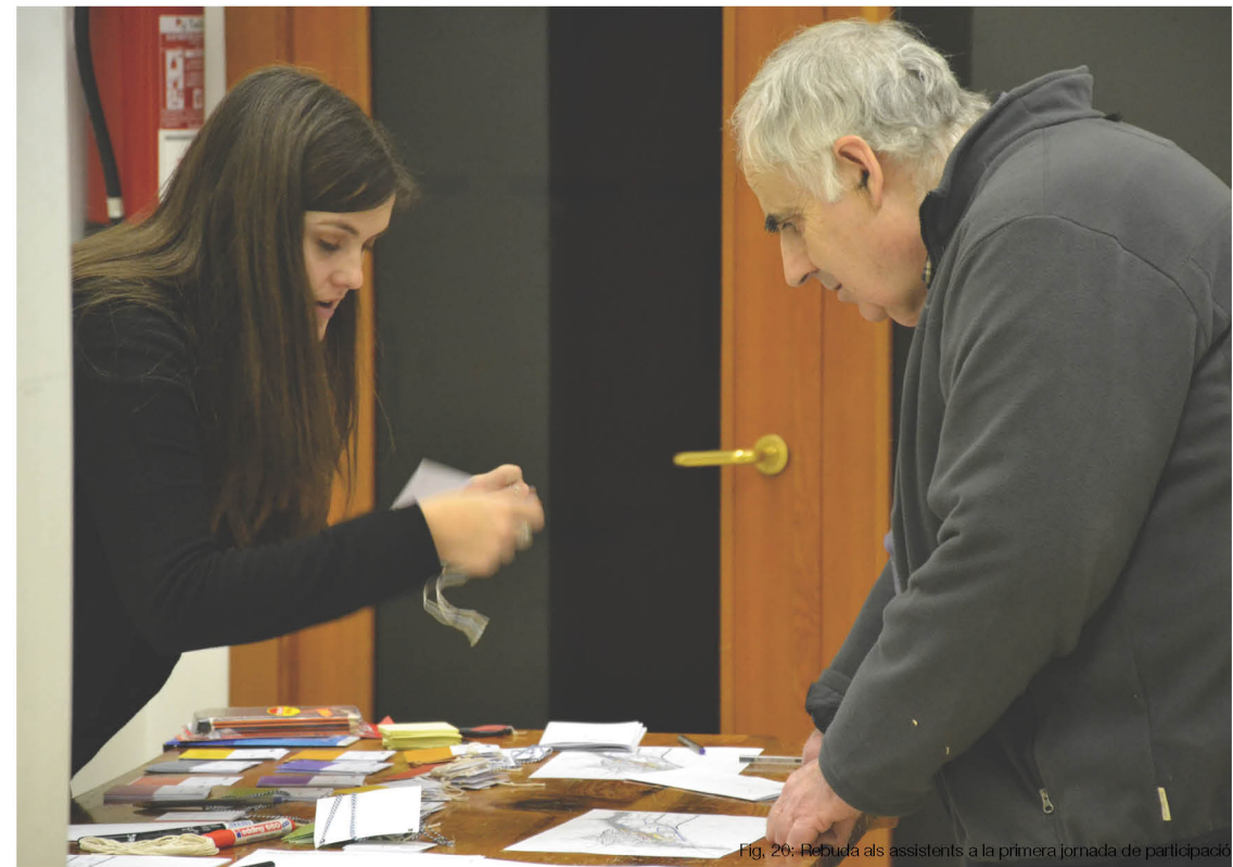
Fig. 20: Rebutada als assistents a la primera jornada de participació