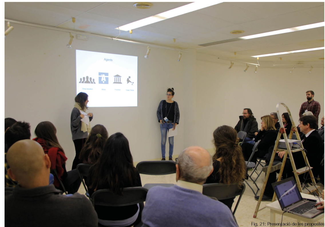
Fig. 21: Presentació de les propostes