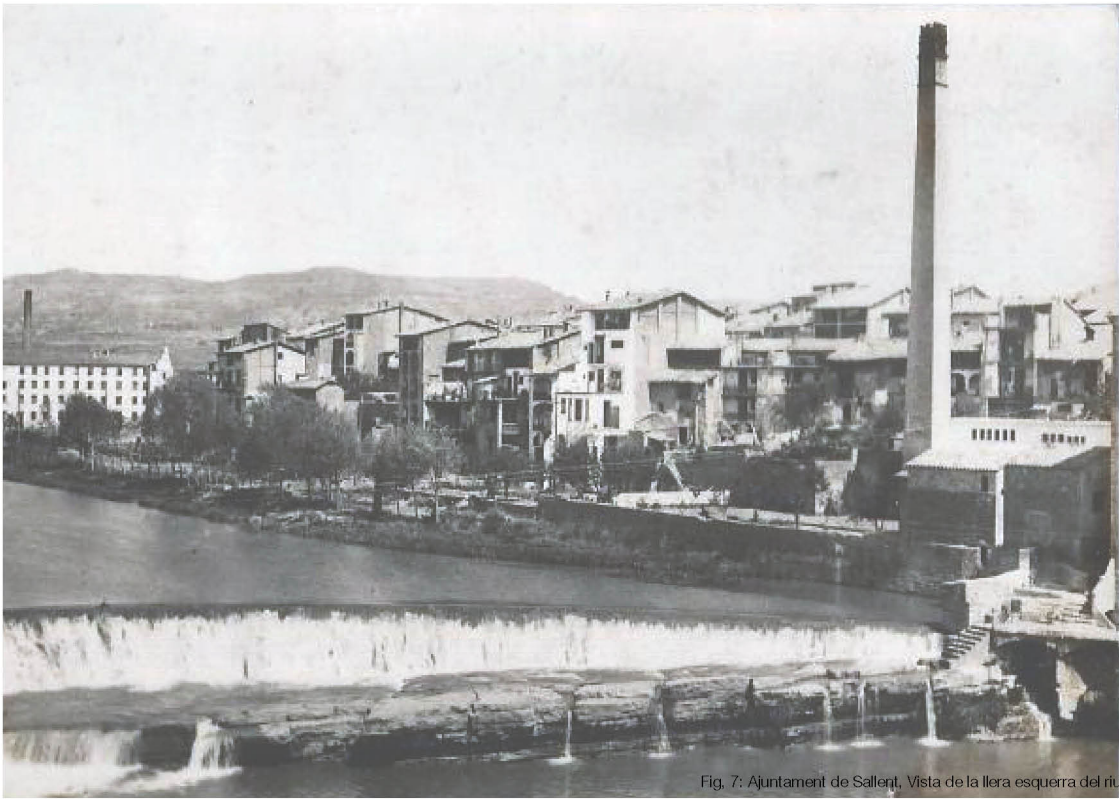
Fig. 7: Ajuntament de Sallent, Vista de la llera esquerra del riu