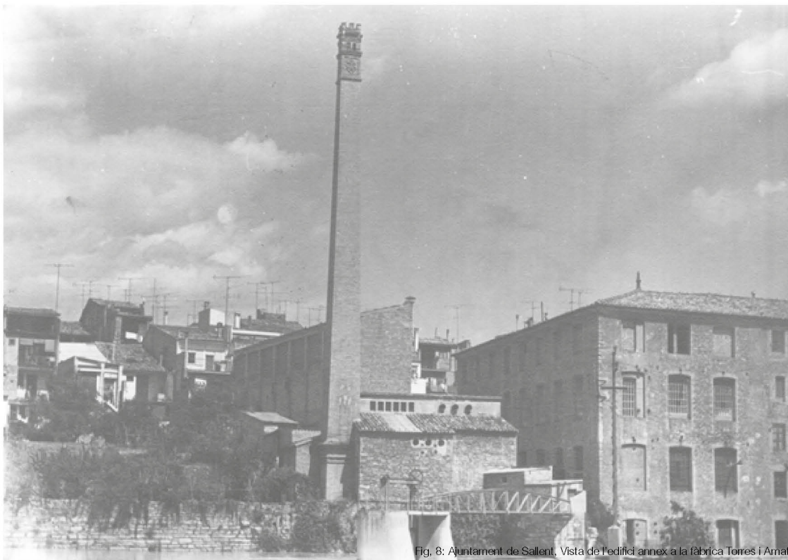
Fig. 8: Ajuntament de Sallent, Vista de l'edifici annex a la fàbrica Torres i Amat