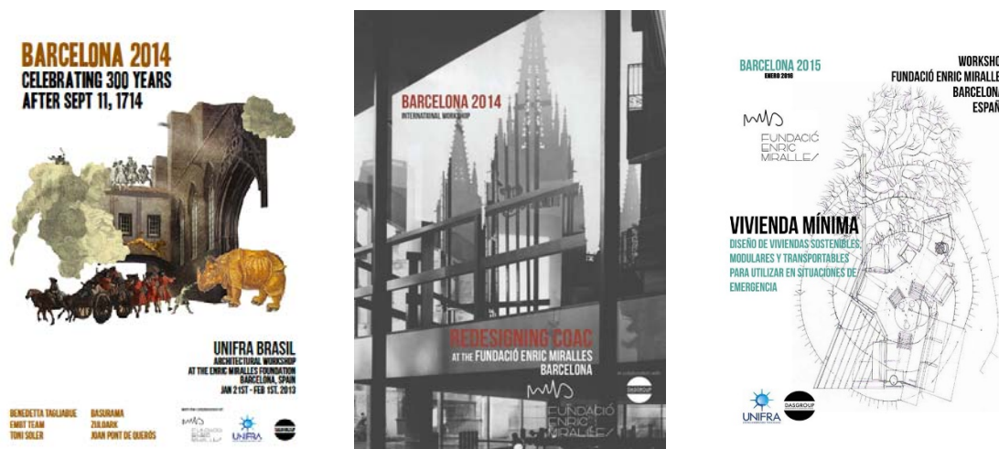
Fig 2: Carteles workshops Fundación Enric Miralles, Das Group y Centro Universitario Franciscano.

El propósito de este relato es una revisión. Una descripción de las metodologías que guiaron las distintas ediciones de este programa en los últimos 4 años, enseñando los resultados y contribuciones de estas prácticas en la pedagogía de esta escuela en sus distintos niveles de enseñanza. Un relato de las transformaciones que no apenas contemplan la práctica y representación arquitectónica sino una nueva forma de sentir, percibir y construir una nueva narrativa sobre el lugar de estas arquitecturas.