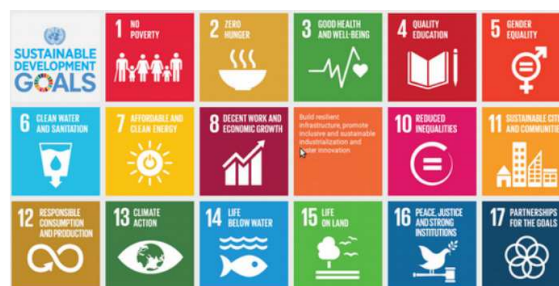
Figura 3. Objetivos de la plataforma para el desarrollo sostenible de Naciones Unidas.

La plataforma para el desarrollo sostenible de Naciones Unidas 14 plantea una serie de indicadores de sostenibilidad agrupados en 17 objetivos. Para cada uno de los objetivos se proponen una decena de indicadores (la cantidad de indicadores depende del objetivo). Algunos de ellos son extrapolables a un proyecto de ingeniería, pero la casuística es enorme y la elección de los indicadores adecuados dependerá fuertemente de la naturaleza del proyecto. La Figura 3