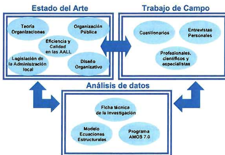
Figura 2. Esquema resumen de la investigación. Elaboración propia.

A continuación se presenta una figura conceptual donde se esquematiza el proceso seguido en la investigación (ver figura 2). En primer lugar el estado del arte recoge las principales aportaciones sobre la eficiencia, la calidad y la excelencia de las administraciones públicas en general y de las administraciones locales en particular. En esta fase se intensifica la búsqueda bibliográfica que apoya la necesidad y la urgencia de reformar el sector público.