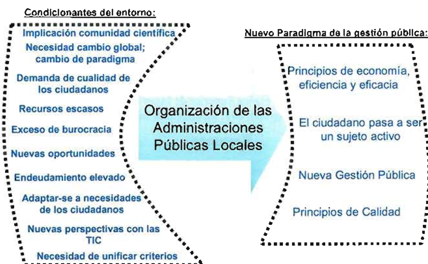
Figura 1. Justificación y relevancia del estudio. Adaptación de Prado y García (2004)

En la figura 1 se representan los condicionantes del entorno que justifican y demandan una nueva manera de organizar la administración pública local para mejorar la eficiencia en la gestión de los recursos públicos y la calidad de los servicios a los ciudadanos.