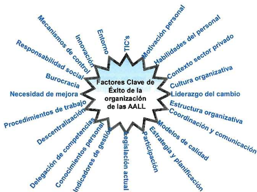
Figura 3. Esquema de los conceptos analizados en los objetivos generales y específicos de la investigación.

Las hipótesis planteadas han sido formuladas en base a los contenidos presentados anteriormente sobre diseño organizativo, cultura organizativa y eficiencia de las administraciones locales. Con esta base conceptual y con el estudio de sus relaciones de dependencia se concretan las hipótesis principales del estudio: