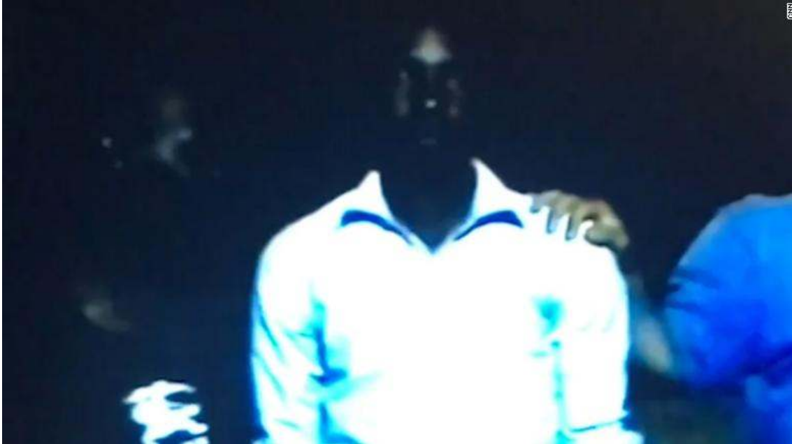
Imagen tomada en una subasta de migrantes en Libia, donde son vendidos como esclavos

https://www.hrw.org/news/2016/12/14/libya-end-horrific-abuse-detained-migrants