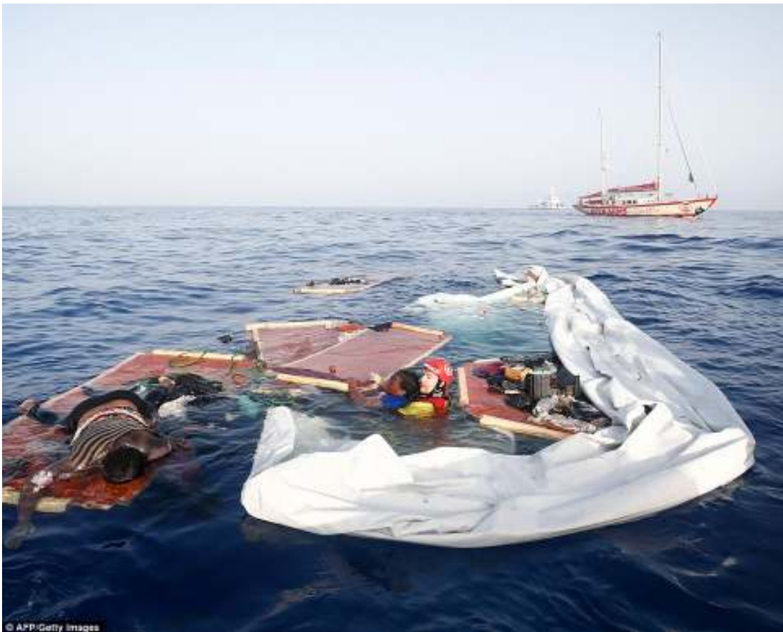
Rescate de la única superviviente del suceso, junto a los cuerpos sin vida del menor y la otra mujer

En el mencionado incidente del mes de Julio, la guardia costera libia incumplió sus obligaciones de asistencia a las personas que se encontraban en peligro, dejando a la deriva a tres personas (dos mujeres y un niño), tras reventar y deshinchar la lancha en la que se encontraban, un episodio que se saldó con la muerte de una de las mujeres y el niño, siendo rescatada con vida la única superviviente por los miembros de la organización “OPEN ARMS”, una superviviente que, tras diversos problemas con la Autoridades de Malta e Italia, finalmente pudo desembarcar el día 21 de julio en Palma de Mallorca.