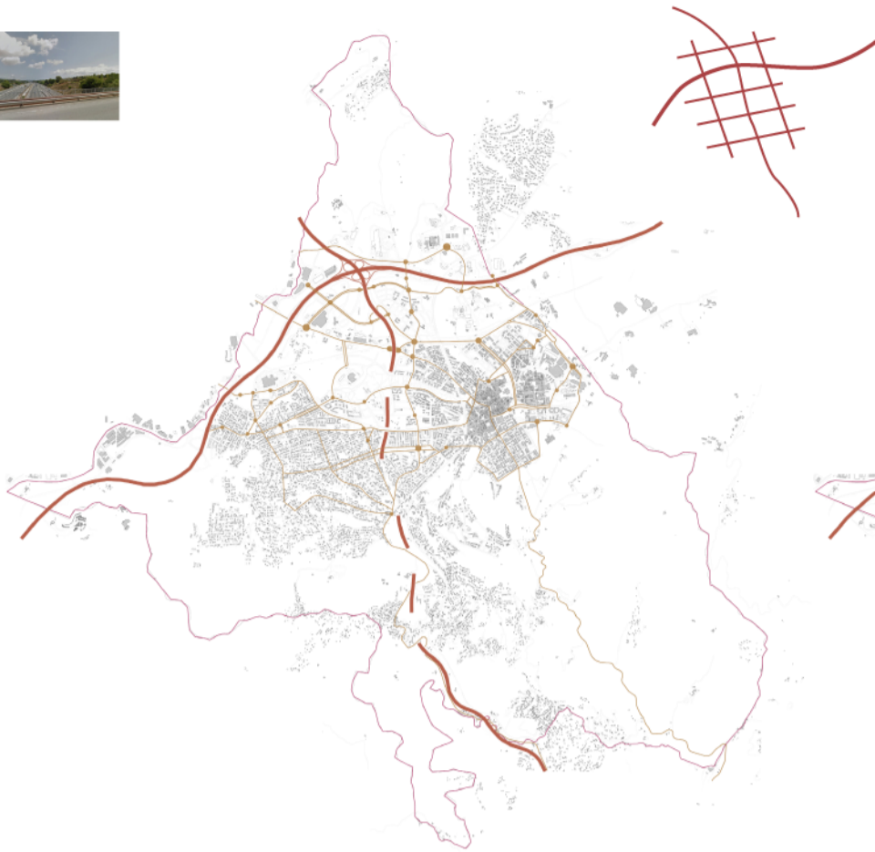
Xarxa de vials actuals e: 1/50.000