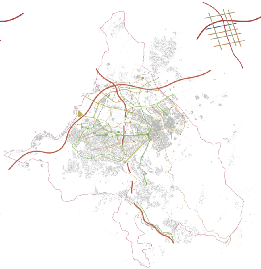
Xarxa de vials proposada e: 1/50.000