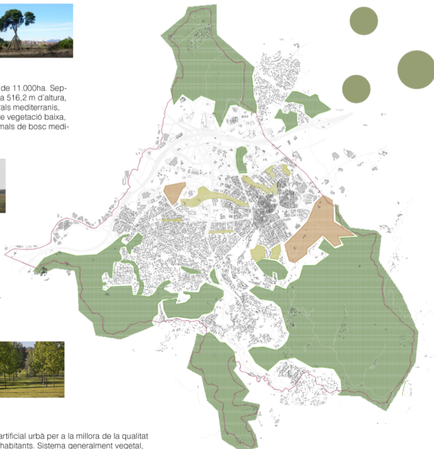
Xarxa de verds actuals e: 1/50.000

Sistema creat per l'home. Sistema que conviu amb l'entorn artificial urbà per a la millora de la qualitat de l'aire i per tant per a la millora de la qualitat de vida dels habitants. Sistema generalment vegetal, amb escassa vida animal lligada als organismes vegetals que l'home implementi. Aquest sistema produeix una sensació de benestar per als habitants però pot ser enganyosa segons el tipus de fertilitzants o plaguicides que es puguin utilitzar en zones properes a la població.