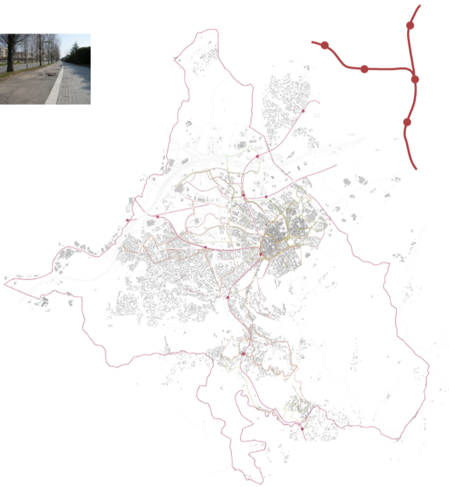
Xarxa de transport públic actual e: 1/50.000