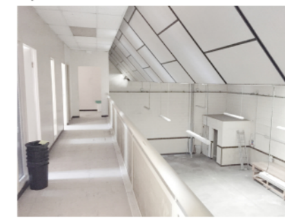
12 - oficines