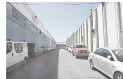
04 - aproximació a la nau des del Passatge Arquimedes