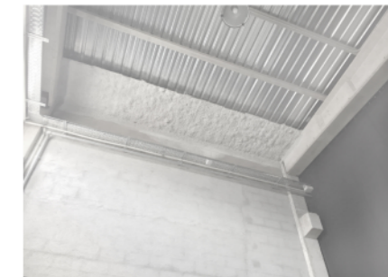
13 - detall unió B