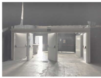
05 - entrada a la nau