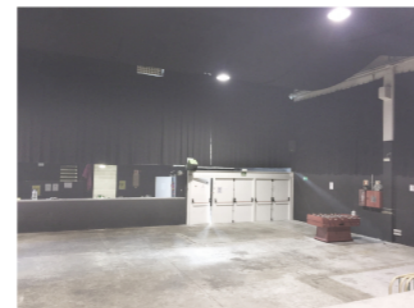
06 - sala de concerts