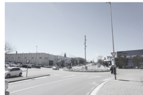
02 - aproximació a la nau des del carrer d'Arquimedes