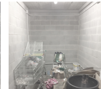
09 - magatzem