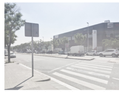
01 - aproximació a la nau des del carrer d'Arquimedes