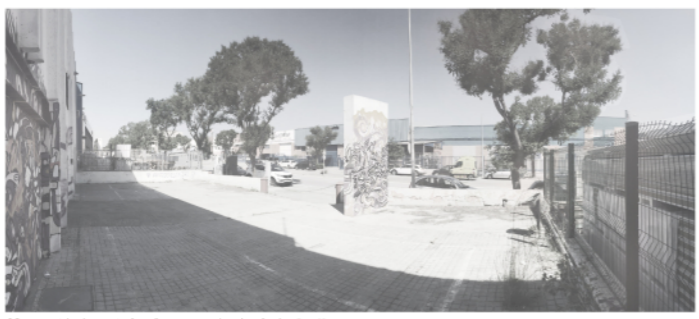
03 - pati davant la façana principal de La Nau