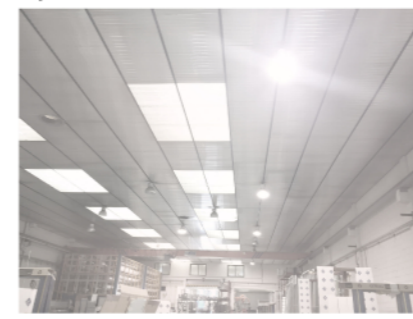
11 - interior diàfan amb ús industrial