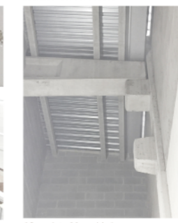
13 - detall unió A