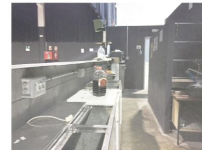
08 - barra del bar / cuina