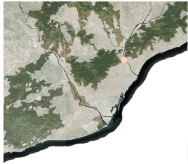
LÍMITS NATURALS_Collserola,Riu Besòs,Serralada de Marina