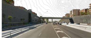
AVINGUDA MERIDIANA separa el Trinitat Nova i Trinitat Vella

L'últim barri reconegut és el de Can Peguera, que es converteix en el tretzé barri en record del seu origen dins el projecte de reubicar, a la segona dècada del segle XX, els obrers que vivien en barraques a Montjuïc en grups d'habitatges coneguts popularment com les Cases Barates. L'extrem superior del districte l'ocupen els barris de Ciutat Meridiana, Torre Baró i Vallbona, amb unes estructures urbanes molt marcades per l'orografia muntanyenca i les grans barreres artificials (autopistes i vies del tren). La resta de barris són els que acumulen més població, com els de la Prosperitat, Porta, la Guineueta, Turó de la Peira i Roquetes.