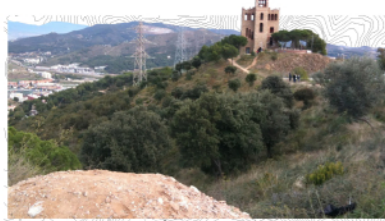
CASTELL DE TORRE BARÓ... un dels símbols de Nou Barris

Nou Barris és un districte de Barcelona a l'extrem nord de la ciutat, entre la serra de Collserola i l'avinguda Meridiana.