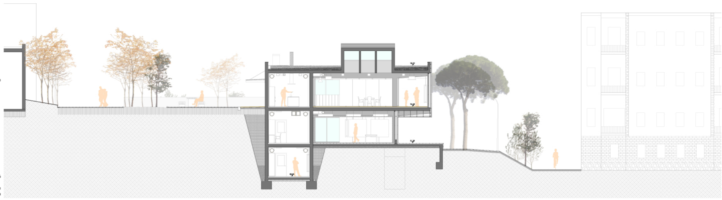
SECCIÓ TRANSVERSAL A-A'

FORJAT TIPUS F1. prellosa prefabricada de 5cm espessor i la resta de formigó in situ armat amb el mallat i negatius F2. biga de cantell de 30x70cm de formigó armat in situ F3. paviment de fusta pi sobre rastrells amb làmina de polietilè i aïllament tèrmic i fonoabsorbent de 5cm