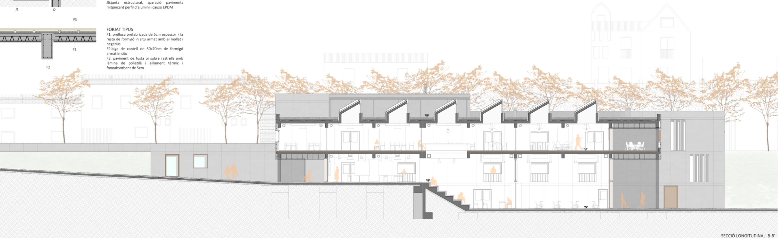
SECCIÓ LONGITUDINAL B-B'