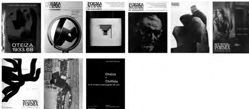
fig.6. Números de Forma Nueva (FN) y Nueva Forma (NF) dedicados a la figura de Jorge Oteiza y de Eduardo Chillida. De izquierda a derecha: Oteiza 1933.68 ; FN 14, marzo 1967 [Jorge Oteiza]; FN 18, julio 1967 [Jorge Oteiza]; FN 19, agosto 1967 [Jorge Oteiza]; NF 89, junio 1973; NF 21, octubre 1967 [Eduardo Chillida]; NF 22, noviembre 1967 [Eduardo Chillida]; NF 51, abril 1970 Eduardo Chillida]; Oteiza y Chillida en la reciente historiografía del arte .