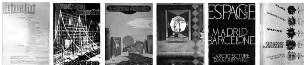
fig. 8. Números de L'architecture d'aujourd'hui (L'a) donde se publicaron artículos sobre arquitectura española previamente publicados en Nueva Forma . De izquierda a derecha: L'a 52, febrero 1966; L'a 128, noviembre-diciembre 1967; L'a 138, febrero-marzo 1968; L'a 139, septiembre 1968; L'a 149, abril-mayo 1970; L'a 159, diciembre-enero 1971-72.