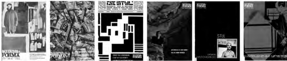
fig. 2 Números de Nueva Forma dedicados a revisar las vanguardias de comienzos del siglo XX. De izquierda a derecha: NF 29, junio 1968 [Constructivismo Ruso]; NF 38, marzo 1969 [Futurismo italiano]; NF 52, mayo 1970 [De Stijl]; NF 58, noviembre 1970 [De Stijl]; NF 75, abril 1972 [Georges Vantongerloo]; NF 62, marzo 1971 [De Stijl].

personalidad. Se construyó, con todo, una crónica-retrato de cada uno de ellos, un estuche de imágenes y documentos que rendía testimonio de la firmeza de sus respectivas trayectorias. Así, Fullaondo reivindicó una construcción histórica a través de 'la vida y obra' de los artífices de la arquitectura; un modo de dar a conocer la escena arquitectónica actualmente utilizado por un alto porcentaje de publicaciones.