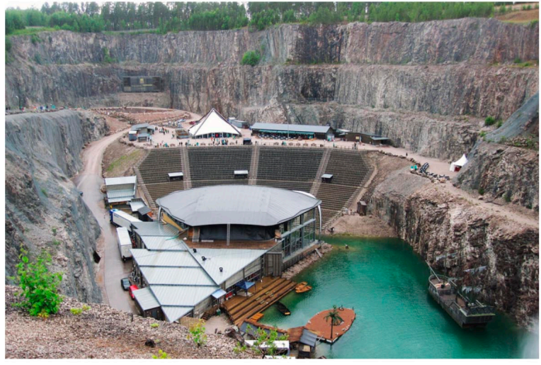
Into the valley - Estònia