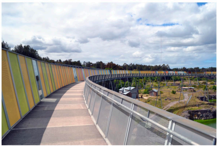
Brickpit Ring Walk Durbarch Block Architects - Sydney