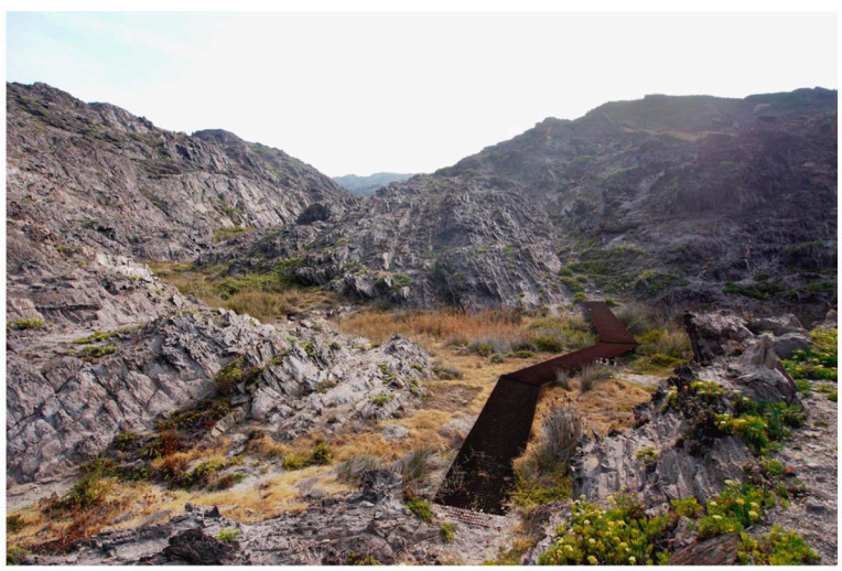
Restauració de Cap de Creus J/T ARDEVOLS - Cadaqués