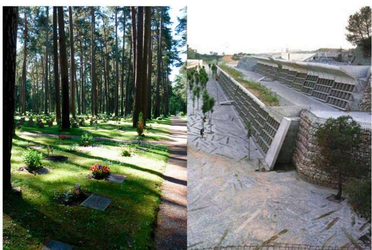
Cementiri del bosc Asplund and Lewerentz Estocolm