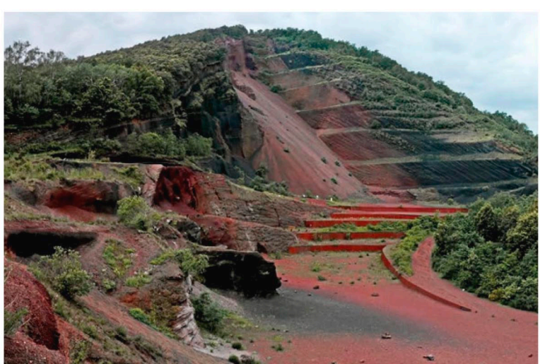
Restauració del volcà d'Olot Martrixà Figueras - Joan Font