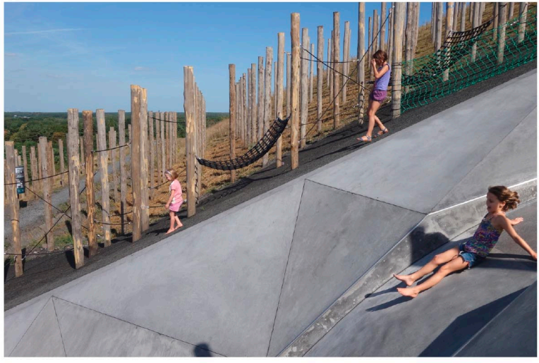
Play Landscape be-MINE Carve + OMGEVING - Bèlgica