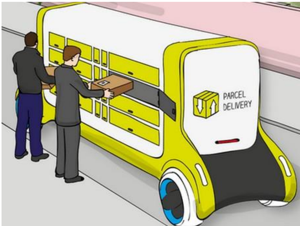
Figura 10.1.4: Prototipo de un vehículo de reparto de paquetería con casillas para las entregas. McKinsey and Company, Parcel delivery: The future of last mile , Travel, Transport and Logistics, 2016