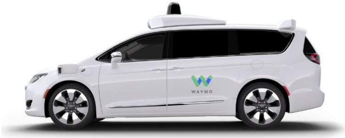
Figura 10.1.3.2: Coche autónomo Chrysler Pacifica Waymo y Chrysler-Fiat. www.eleconomista.es