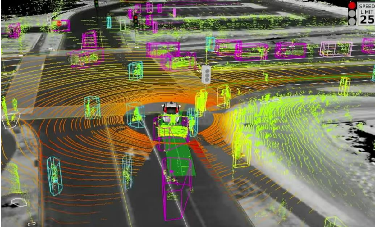
Figura 10.1.1: Representación de la información captada por un sensor Lidar.