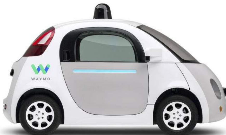
Figura 10.1.3.1: Coche autónomo Firefly diseñado por Waymo.