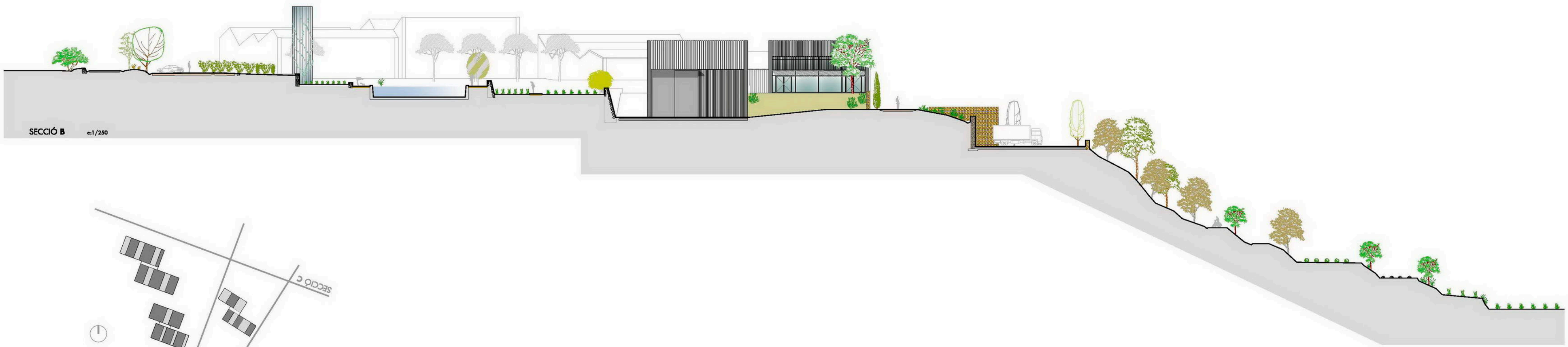
SECCIÓ B es1/250