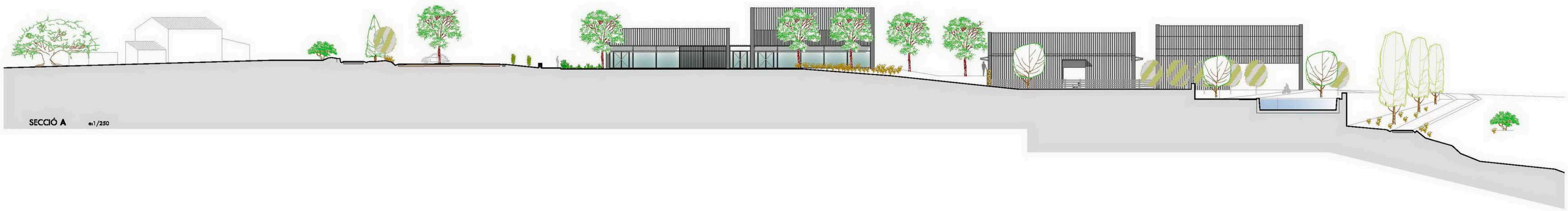
SECCIÓ A es1/250