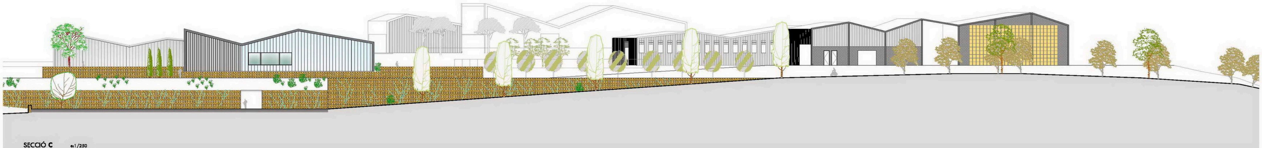
SECCIÓ C es1/250