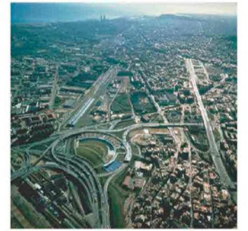
1992 Vol aer

Arran de la construcció del Nus la permeabilitat del teixit es va veure afectada, propiciant un dibuix clarament favorable a l'automòbil. Suposant així una gran barrera per als vianants.