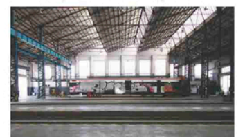
2016 Nau d'acostament, tallers Rendè

Les naus, construïdes en etapes diferents, creen un gra disseminat. Això posa en dubte el bon funcionament i la unitat del conjunt. És important acotar i establir l'ús de cada una d'elles, identificant les seves potencialitats i el seu valor. L'actuació haurà de respectar i reinterpretar els vestigis existents