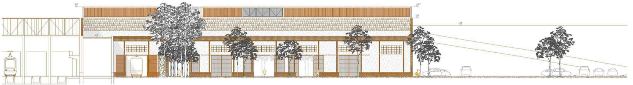
Alçat SE-NO 1:250