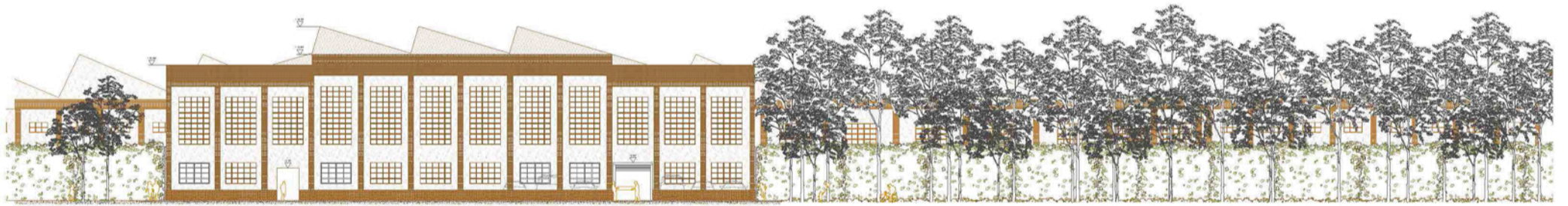
Alçat NO 1:250