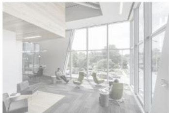
Biblioteca pública de Lawrence (USA) - Gould Evans