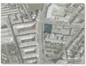
Visia sud [Carrer d'Alfons el Magnànim en primer terme, nous habitatges del barri del Camp Redó i complex militar en procés de reforma urbanística]