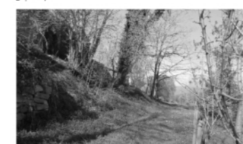
„Corri façana est masia