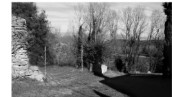
„Espai entre l'habitatge i la Masia