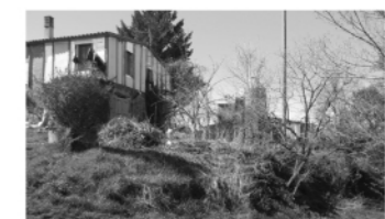
„Façana nord habitatge