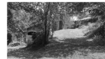
„Entrada al Fener