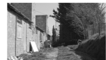
„Corri d'accés a la nau porcina