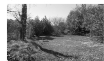
„Terrassa sud i escultura