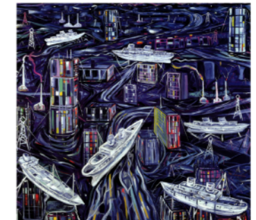
Sèrie Paisatges urbans Oli sobre tela 92x92 cms. 2002