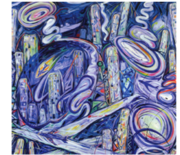
Sèrie Paisatges urbans Tècnica mixta sobre tela 210x120 cms. 1999