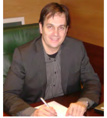
Josep Armengol Arquitecte Generalitat de Catalunya Subdirector General de Planificació Territorial i Paisatge