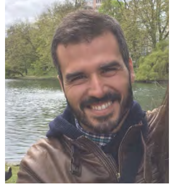
Ton Padullés Arquitecte Àrea Metropolitana de Barcelona