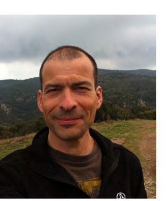
Josep Canals Parc de Sant Llorenç del Munt