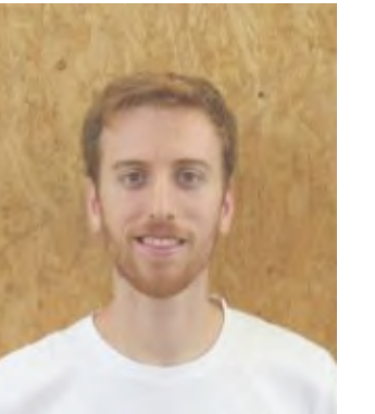
Adrià Martín Arquitecte Cítica / RELS