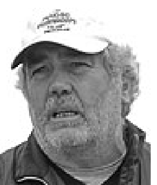
Ton Ardèvol Aparellador Ardevois sl