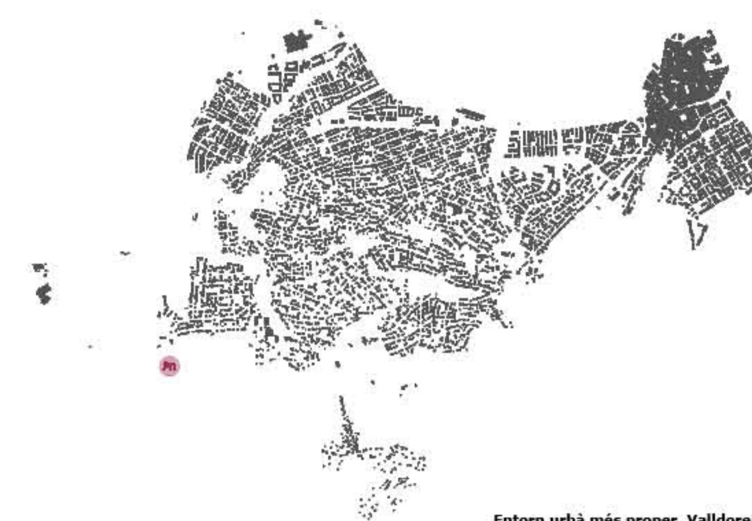
Entorn urbà més proper. Valldoreix

FONTS DE MATÈRIA ORGÀNICA DE QUALITAT -Ramat d'ovelles de Valldoreix ubicat a la masia de Can Cussó a 1,5 km de distància. -Hípica de Can Domènech situada a 2km de distància. -Plantes de tractament de Sant Cugat i de Torrelles de Llobregat d'on es pot extreure compost.