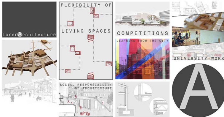
Figura 1: Ejemplo de Portafolio de un estudiante de final de grado

Google Sites, al no ser una plataforma libre y estar limitada su capacidad de almacenaje, nos planteó algunos problemas, por este motivo en este curso 2015-16 se está haciendo una prueba piloto con la plataforma Wordpress vinculada a la Universitat Politècnica de Catalunya. Cada estudiante tiene un perfil que coincide en claves de acceso con las mismas que tiene para su acceso a la plataforma Moodle. Dado que este año por primera vez la asignatura es anual y no cuatrimestral nos permite poder hacer un mejor seguimiento del trabajo de los estudiantes. La prueba piloto se está desarrollando en tres grupos de alumnos de primero del grado de arquitectura, cada grupo está formado por una media de 70 alumnos, cada estudiante realiza su propio blog individual y puntualmente se realizará algún ejercicio en grupo que también se incluirá en el mismo. En este momento, los alumnos han finalizado la primera fase del blog e iniciando la segunda.