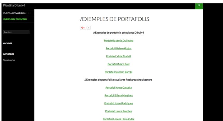
Figura 8. Página acceso a ejemplos portafolios.

Para poder ayudar a los estudiantes en la realización del blog también se les facilita un link a una página web donde podrán encontrar ejemplos de blogs, ver figura 8, realizados durante otros cursos por estudiantes de Dibujo I y también diferentes portafolios realizados por estudiantes como trabajo de final de grado de Arquitectura.