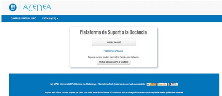
Figura 3: Plataforma Moodle, versió UPC: Atenea

Moodle es una plataforma de aprendizaje diseñada para proporcionar tanto a educadores, como a estudiantes un sistema robusto y seguro donde crear ambientes de aprendizaje personalizados, ver figura 3.