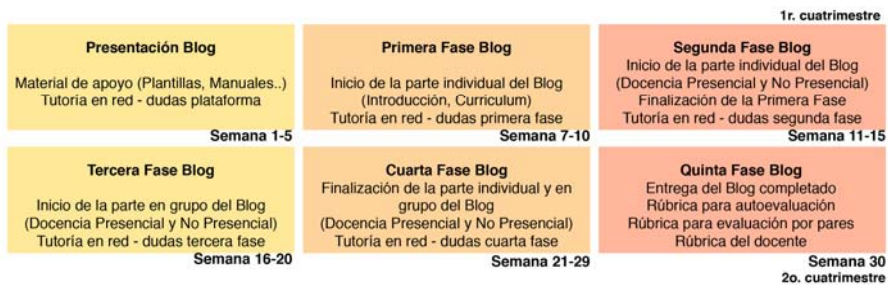
Figura 6: Planificación de ejecución del blog

Para garantizar el éxito del proceso de enseñanza, consideramos que las ayudas que los alumnos deben recibir para la elaboración de sus blogs son un factor importante e imprescindible y han de ser entendidas como mecanismos para facilitar al estudiante la construcción de conocimiento. Estas ayudas pueden ser proporcionadas por el profesor, por ser el agente experto en el contenido del aprendizaje: por un estudiante (compañero del aula) o por la propia plataforma utilizada para la construcción del blog. En cada una de las fases del Blog se ha previsto un apartado de tutorías que se realizará en red a través de la plataforma Moodle, Atenea, para que los estudiantes puedan solucionar todas las dudas que se les vayan planteando tanto de la plataforma como del contenido.