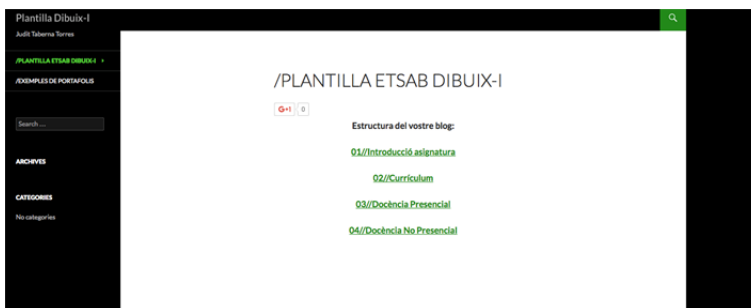
Figura 7: Plantilla Wordpress

La docencia de la asignatura de Dibujo I se divide tal y como se requiere para los estudios de grado según el plan Bolonia, en una parte que llamamos presencial, que el estudiante trabaja y desarrolla en el aula tanto en las clases teóricas como en los ejercicios que complementan los conceptos trabajados en las clases con el profesor realizando el seguimiento de los diferentes ejercicios, y otra parte que denominamos no presencial, que el estudiante desarrolla fuera del aula y que también forma parte de su aprendizaje trabajando una serie de ejercicios que complementan su formación y con los que tiene que demostrar que ha entendido los conceptos trabajados en la clase con el profesor.