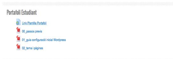
Figura 4: Documentación en Atenea.

Además de presentar la planificación del curso, la plataforma Moodle es usada para el desarrollo y la evaluación de la asignatura. Mostramos a continuación una imagen de lo que ven los estudiantes al entrar en Moodle.