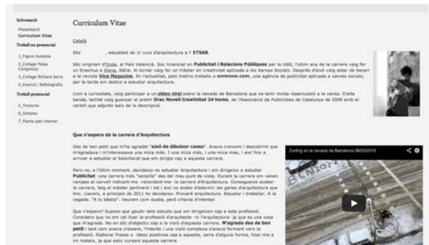
Figura 2: Ejemplo de Blog de un estudiante de Dibujo I.

Google Sites, al no ser una plataforma libre y estar limitada su capacidad de almacenaje, nos planteó algunos problemas, por este motivo en este curso 2015-16 se está haciendo una prueba piloto con la plataforma Wordpress vinculada a la Universitat Politècnica de Catalunya. Cada estudiante tiene un perfil que coincide en claves de acceso con las mismas que tiene para su acceso a la plataforma Moodle. Dado que este año por primera vez la asignatura es anual y no cuatrimestral nos permite poder hacer un mejor seguimiento del trabajo de los estudiantes. La prueba piloto se está desarrollando en tres grupos de alumnos de primero del grado de arquitectura, cada grupo está formado por una media de 70 alumnos, cada estudiante realiza su propio blog individual y puntualmente se realizará algún ejercicio en grupo que también se incluirá en el mismo. En este momento, los alumnos han finalizado la primera fase del blog e iniciando la segunda.