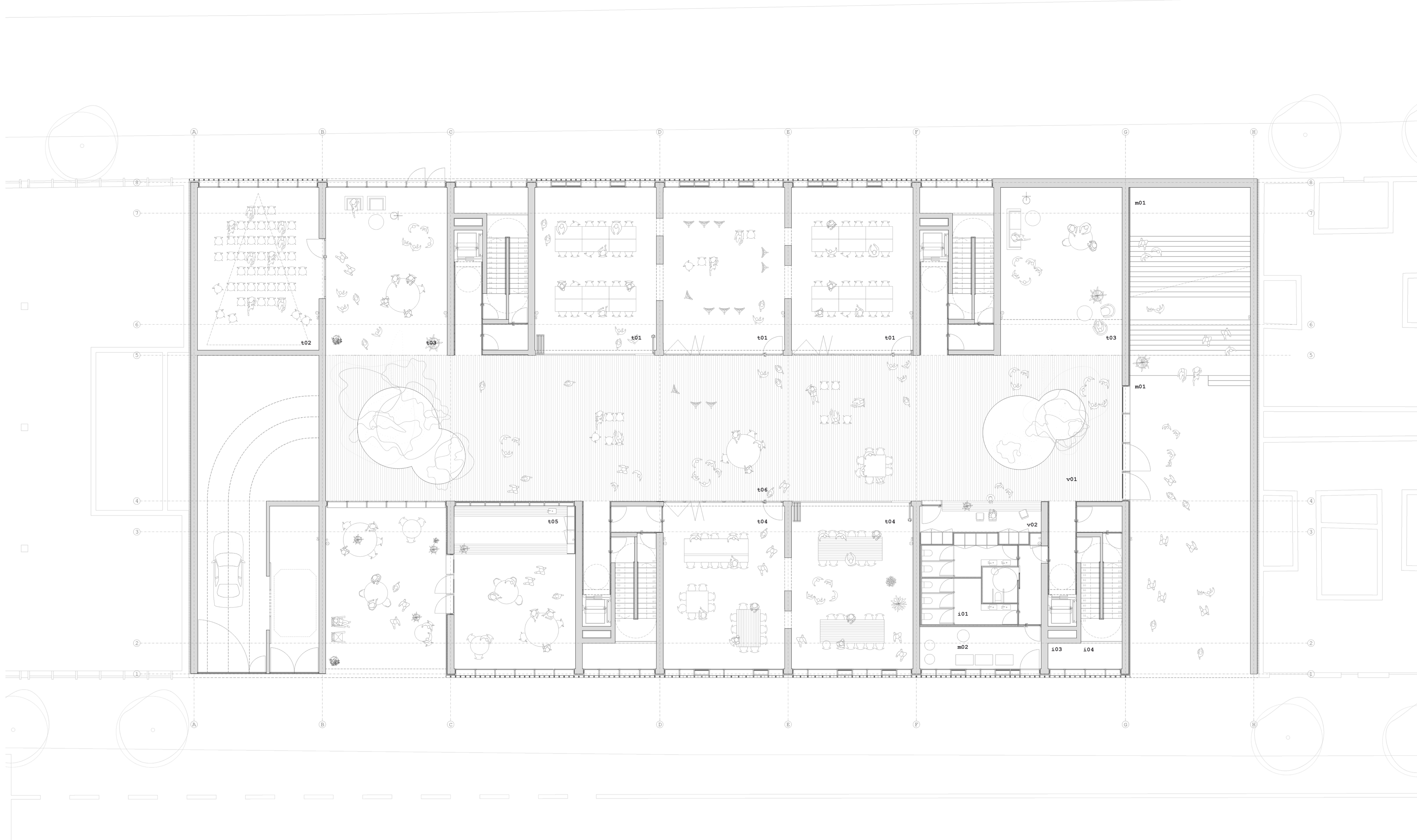
planta baixa 1:100