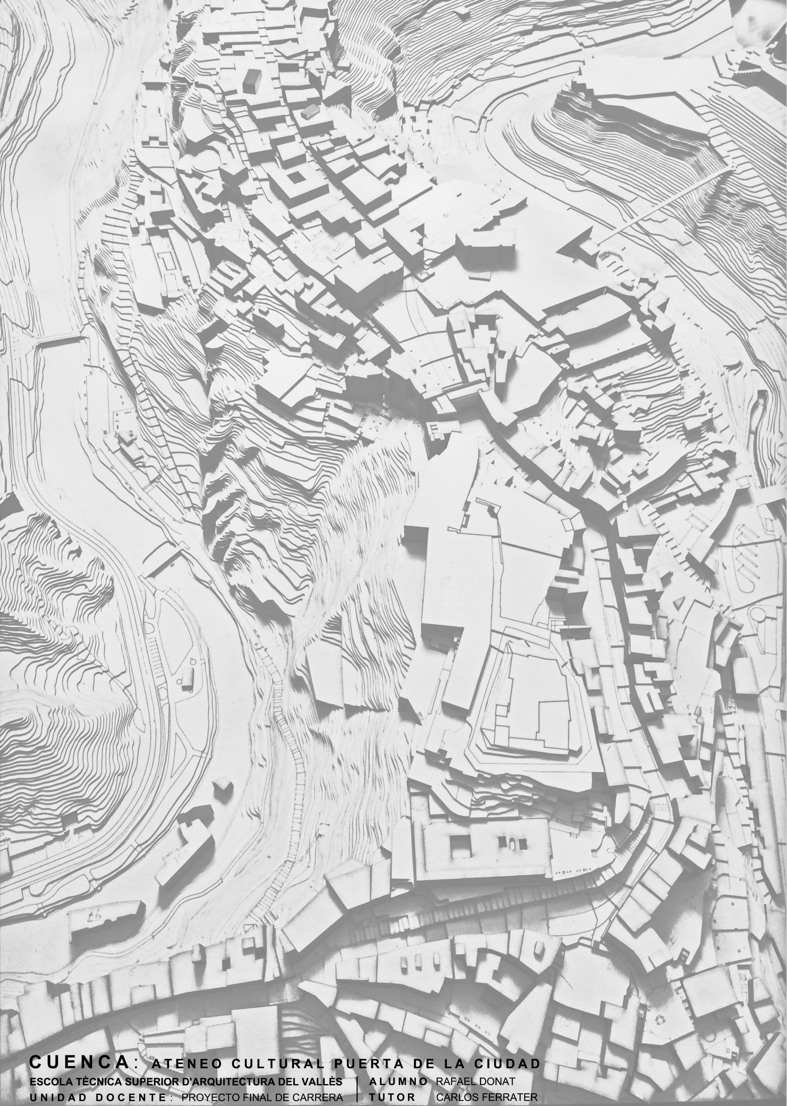
Mapa de llenos: Grano urbano