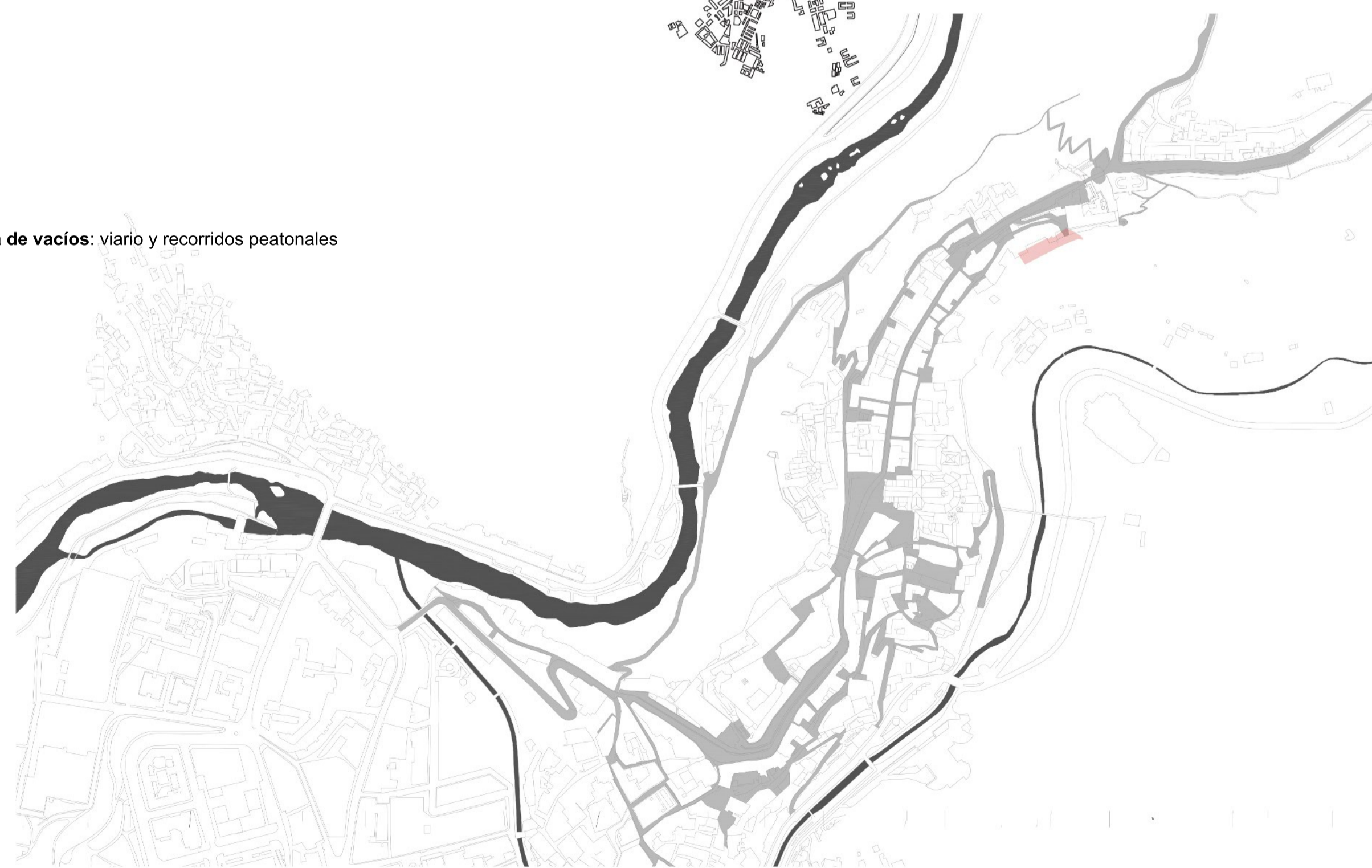
Mapa de vacíos: viario y recorridos peatonales